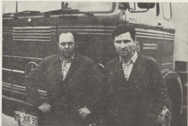
Slavljenca ob svojem junaku