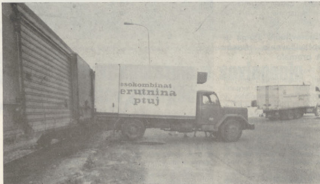
Vagoniranje piščancev za izvoz

Drugi spodbuden proizvodni rezultat je premosti-