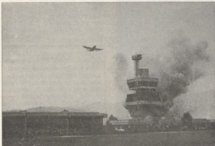
Na medrepubliški vaji CZ v Mariboru.