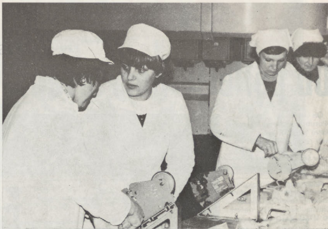
Dobro delo je jamstvo za lepši jutri

Ugotovitev konference je bila, da postavljene planske cilje še sicer kar zadovoljivo izpolnjujemo, vsekakor so rezultati boljši od lanskih, posebna skrb je namenjena izvozu, ki je kljub težavam aktiven, vendar s tem ne smemo in ne moremo biti zadovoljni. Pri-zadevati si moramo plan prekoračiti čeprav je dokaj realen. Analize tega obdobja pa kažejo, da nekatere TOZD oziroma delovne enote celo zaostajajo za planom. (Podatki so bili na razpolago za prvih pet mesecev). Stvar je še toliko bolj kritična, ker se zaostajanje najbolj odraža v enotah z živo proizvodnjo, ki je temelj naše proizvodnje. K razmišljanju nas spodbuja to, da znotraj TOZD Perutninske farme, posamezne enote različno dosegajo oziroma ne dosegajo postavljenih normativov. Tudi z brojlarsko proizvodnjo ne moremo biti zadovoljni, da-siravno je bil plan dosežen. Ob tem, ko farma Breg do-