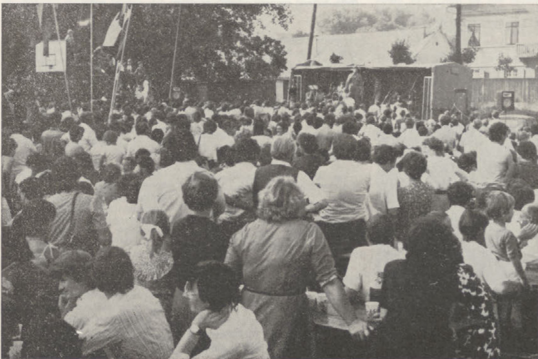
Navdušena množica nekaj tisoč obiskovalcev je od znanega Šraufcigerja pričakovala več