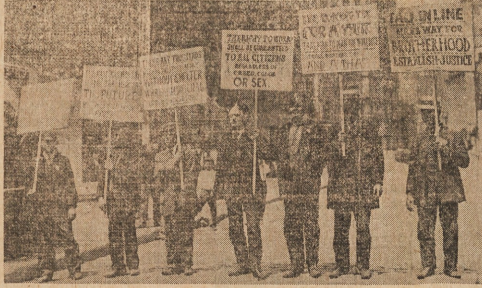
PARADE of unemployed men on May 31, 1909 in New York City.