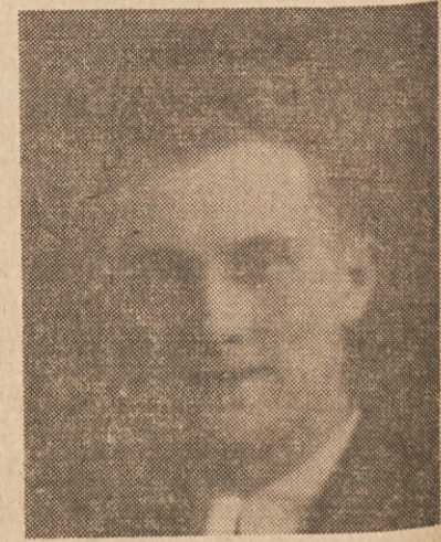
OB 14. OBLETNICI