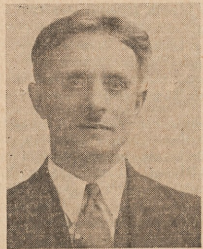
OB 20. OBLETNICI