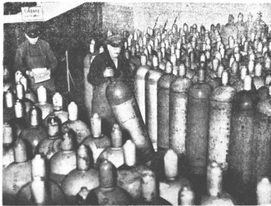
Skladišče pogonskega plina za avtomobile v Berlinu.

Krušna moka bo stala pri nas na drobno, kakor so izračunali 4,90 do 5 din, bela pa 8,90 do 9 din za kg. Cena beli moki bo torej zelo visoka, a krušni sicer znatno nižja, vendar še zmerom razmerno visoka. Za Slovenijo, ki mora uvažati mnogo žita in moke, bo to hudo breme.