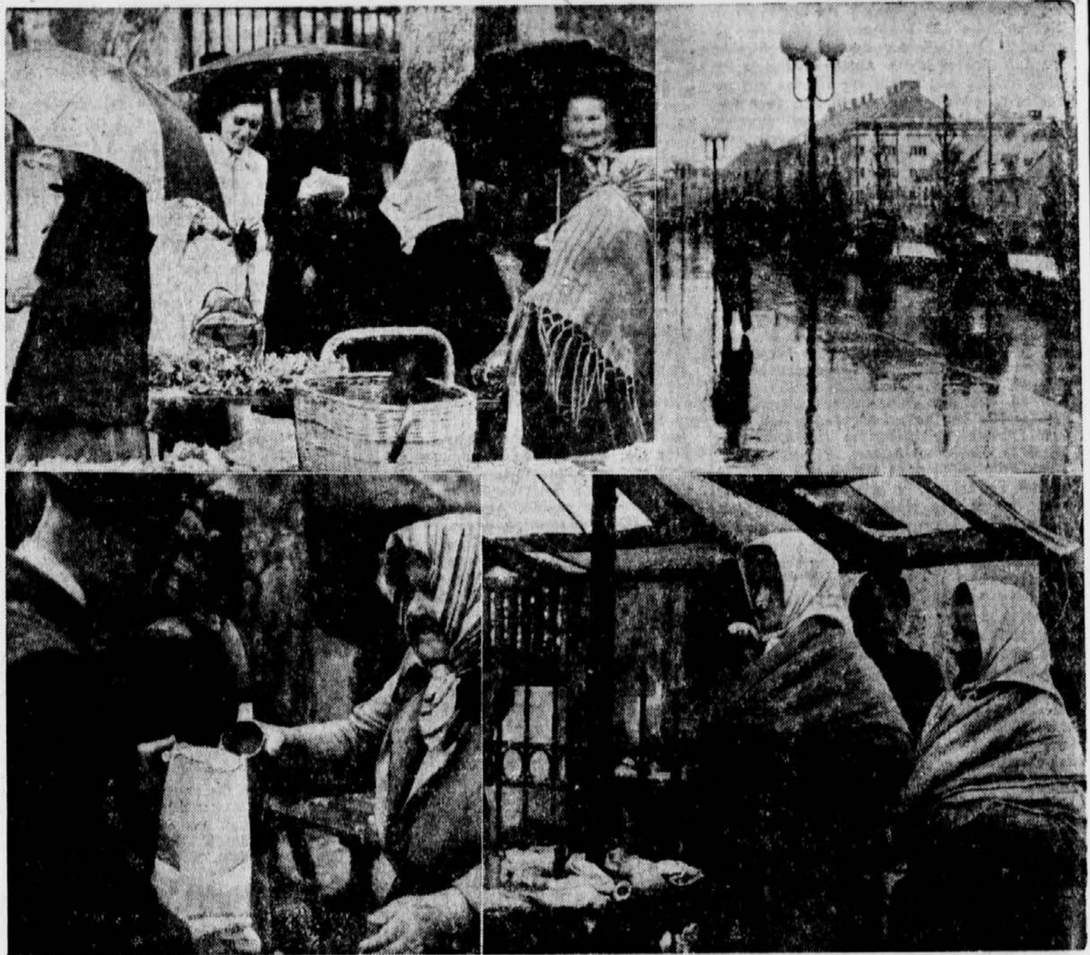
Links oben: Auf dem Marburger Gemüsemarkt; unten: Fröhlich lächelnde Marktfrau trotz Wind und Nässe; rechts oben: Glanzlichter des Regens in der Tegethoffstraße; unten: Mit Kopf- und Wolltuch unter der schützenden Plane.

Ein vom Pech verfolgter Bildberichter meint: Marburg hat auch bei Regen seine Reize