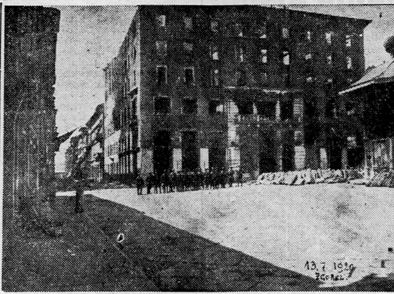
Ko je 13. julija 1920 gorel Narodni dom v Trstu, je italijanska vojska ščitila — požar in gasilci niso smeli

Kazalo je, da se bo v nekaj letih bogato razmahnilo prosvetno delo in življenje tržaških Slovencev. Toda nove zunanje politične raz-