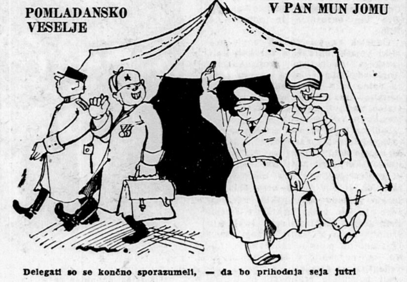
Delegati so se končno sporazumeli, da bo prihodnja seja jutri

Pan Mun Jom, 18. apr. (AFP). Kitajski in severnokorejski predstavniki so spregovorili na današnjih pogajanjih v Pan Mun Jomu predlog Združenega poveljstva, naj bi se nadaljevali zaupni razgovori o izmenjavi ujetnikov. Ta pogajanja so prenehala 4. aprila, ker so Kitajci in Severnokorejci vztrajali na tem, naj bi obvezno repatriirali ujetnike, medtem ko je zahtevalo Združeno poveljstvo prostovoljno repatriacijo. V podkomisiji za nadzorstvo primirja, ki proučuje gradivo letališč in udeležbo Sovjetske zveze v nevtralnimi komisiji, se pogajanja še zmerom niso pomaknila z mrtve točke.