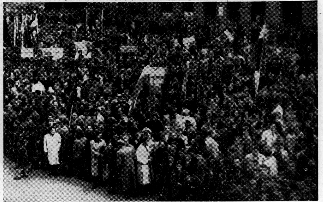
V četrtek popoldne se je na Glavnem trgu v Mariboru zbralo nad 30.000 ljudi, ki so ogorčeno demonstrirali proti mešetarjenju v Londonu in proti italijanskemu klerofašizmu

Prav tako kot profesorji in učitelji (Nadaljevanje na 2. strani)