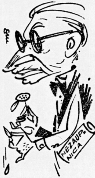
De Gasperi: »Da, ne, da... ne. Torej ne; naj pa Scelba dobi mandat.«

Pariz, 8. febr. (Tanjug). — Francoska narodna skupščina bo po 3-tedenskem predsedku jutri spet zasedala. Odobrili mora še proračun ministrstva za prosveto in narodno obrambo, ki sta bila konec prejšnjega leta zavrnjena, tako da ti dve panogi poslujeta začasno z dvanaestimi. Najvažnejše vprašanje, ki ga mora obravnavati francoski parlament, pa je ratifikacija pogodbe o evropski obrambni skupnosti in z njo v zvezi revizijske ustave. Glede na sedanj položaj bodo verjetno predlog za ratifikacijo pogodbe o evropski obrambni skupnosti obravnavali šele po končani konferenci ministrov za zunanje zadeve v Berlinu.