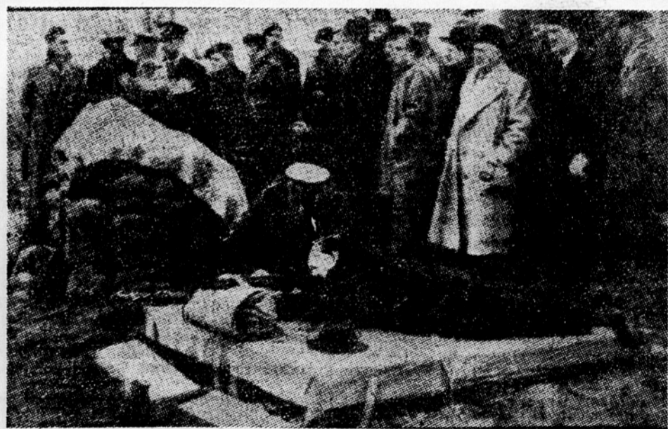
Belgijska puška, ki jo bo odvslej uporabljala britanska vojska, je povzročila v londonskem parlamentu precejšnje razprave. Na laburistične pripombe, ki so bili proti temu, da bi v britansko vojsko uvedli belgijsko puško, je moral odgovorjati sam predsednik vlade Churchill. Razprava se je končala s tem, da so laburistični in konservativni poslanci preizkusili novo puško in njene kvalitete