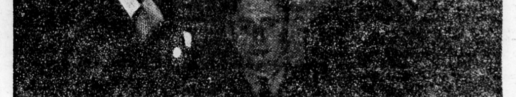
Bidault in Molotov

Drugi opazovalci pa so bolj črnogledi in pravijo, da dostojni bilo nobenega uradnega potrdila o morebitni pripravljenosti zahodnih sil za popuščanje v tem smislu.