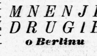
The New York Times

tifikaciji sporazuma 30 do 40 divizij, t. j. dvakrat toliko kot jih bo imela Francija. Senatni odbor za narodno obrambo je proučeval na seji poročilo o evropski vojski. Poročilo izraža dvom glede vojaške vrednosti in učinkovitosti integracije ter daje prednost klasičnemu sistemu koalicijskih armad. Težave s koalicijo ne bi bile tako velike kot težave zaradi prehitre integracije.