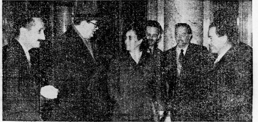
Skupina zveznih poslancev iz Slovenije pred začetkom skupne seje odborov za gospodarstvo in proračun

Ljubljana, 11. febr. Velenjski rudarji so nakopali januarja rekordno količino lignita v zgodovini tega rudnika. — 65.000 ton. Januarja lanskega leta je bilo proizvedeno 37.000 ton lignita.