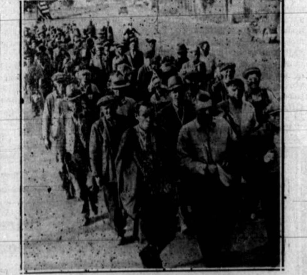
Na sliki je skupina bivših vojakov, kakršne so druga za drugo dan na dan prihajale prošli par tednov v Washington z zahtevami, da naj jim kongres odobri takojšnjo izplačilo bonusa. S svojo demonstrativno akcijo so spravili ti bivši vojniki kongresnike, ki v vseh kampanjah vse obljubljajo, vladni policiji v težke zadrege. S hrano jih je oskrbovala nekaj časa policijska oblast in potem privatna dobroteljskost.