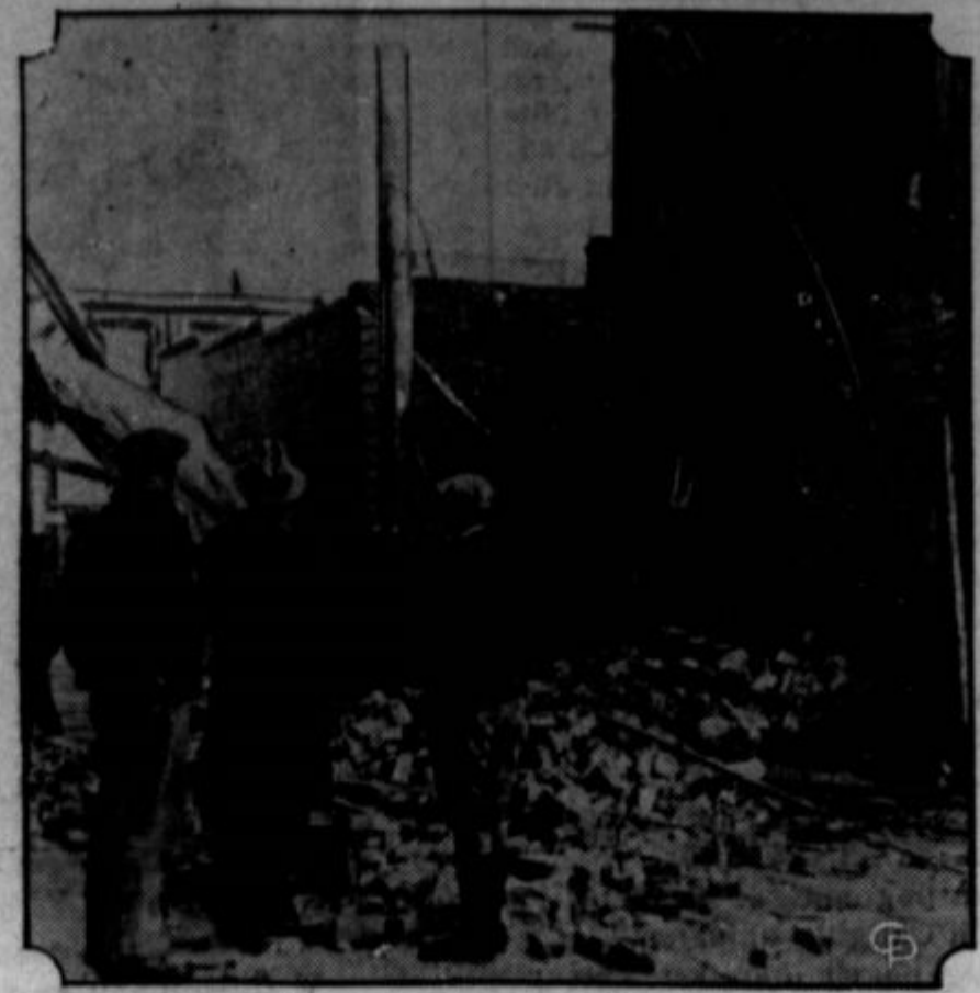
Potres, ki se je dogodil v Elreki, Cal., je povzročil posej škoda, kar lahko vidite na sliki. Neko žensko je ruševce se poslopje ubilo.

Komunistični Mednarodni delavski obrani je konvencija pripeljala $25. Bil bi bolj na mestu, če bi podprla American Civil Liberties Union, katera v resnici porabi vsak dobljeni cent v obrambo pravic pregajanih delavcev neglede na prepričanje ali vero.