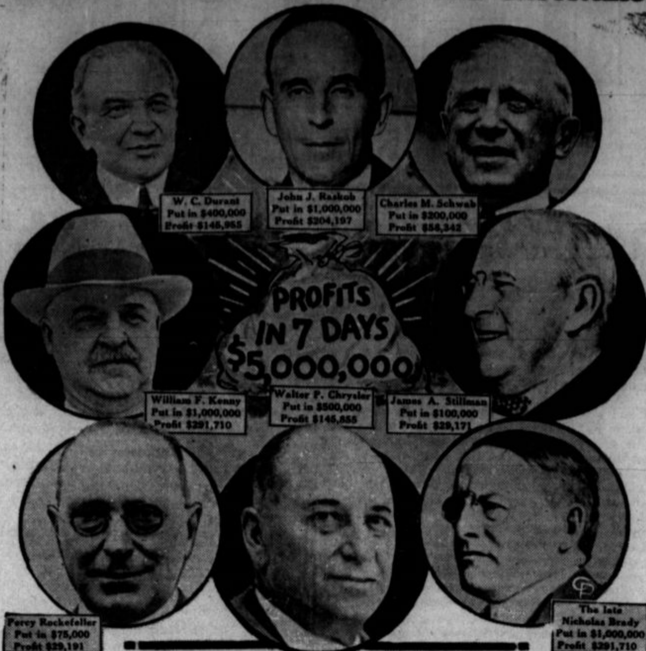
A "Grand Stock Market Pool", which netted millions of profits in a less than a week's time to the above exploiters of worker. They are "vacuum cleaners" of the people's pockets.

čene vsote odštete l. 1920 naprej. Slabi časi in pa prevelika izplačila so konvencijo primorala sprejeti novi sistem.