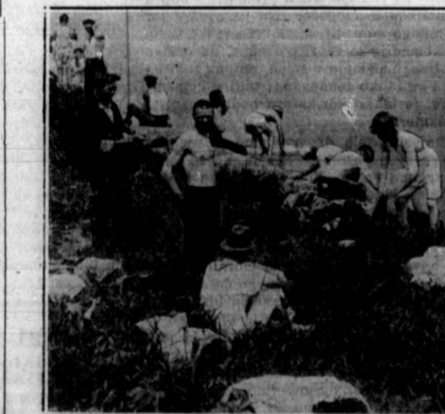
Zdravstveni komisar v Washingtonu je dobra dva tedna nazaj pričel sanitarne razmere v taborih veteranov, ki so prišli zahtevati bonusa, in dejal, da nesnaga, ki se veča, resno ogroža zdravstvo ne samo veteranov, nego prebivalstva v Washingtonu vohče. Na tisoče veteranov je namreč taborilo ob reki Potomac, ki je že sama na sebi nesnaga, a je veteranom služila za kopalnico, pralnico ter tudi druge potrebe.