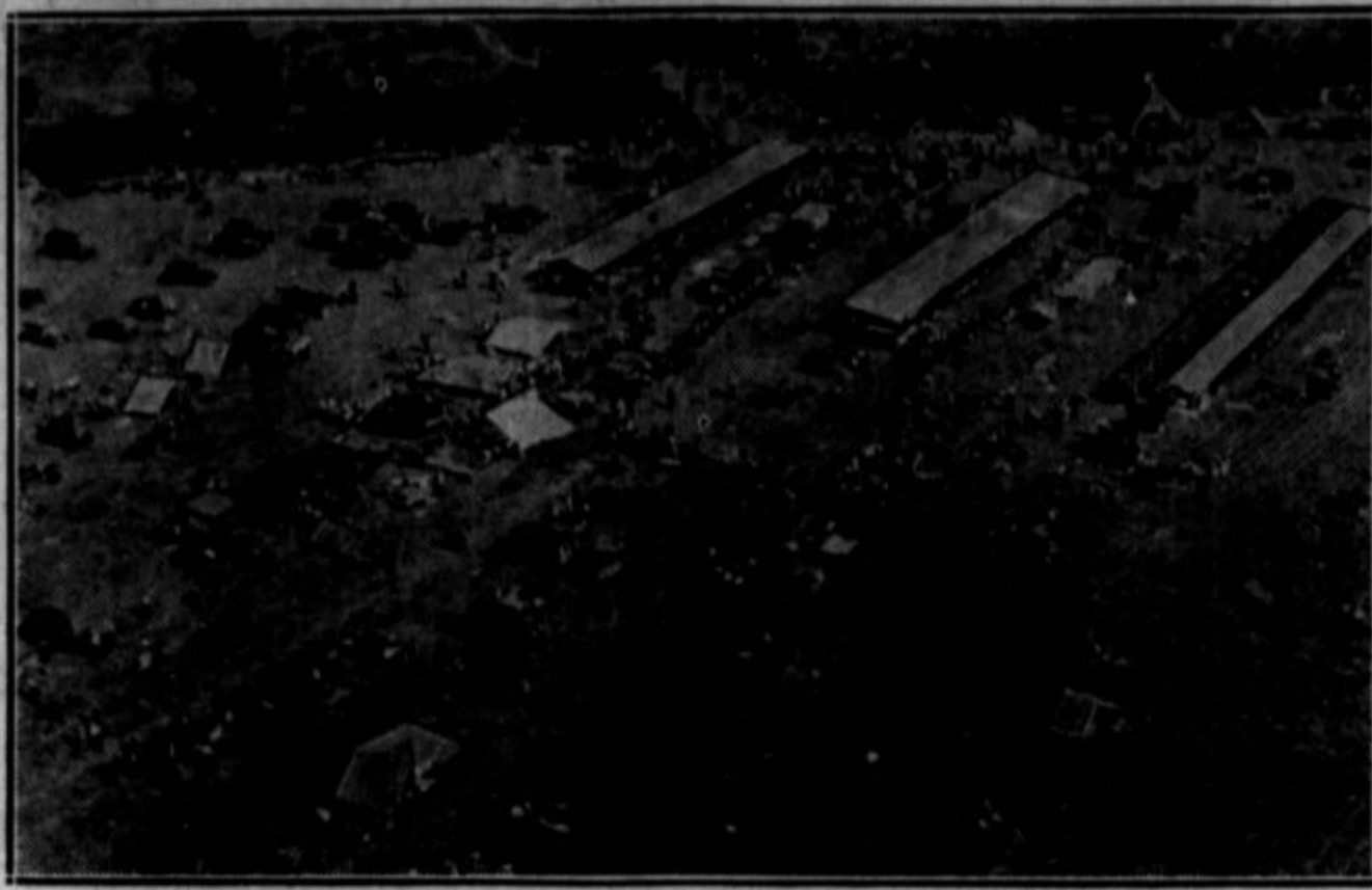
Na sliki je tabor bivših vojakov, ki so prišli iz vseh krajev Zed. držav v Washington, da demonstrirajo za bonus. Okrog dvajset tisoč jih je dospelo vseh skupaj. Kongresniki so na njih pritisk sprejeli predlogo, da se bivšim vojakom izplača ves bonus takoj v vsoti nad dve milijardi dolarjev, v madi, da jo bo senat zavrgel, če pa bi se zbal tudi senat, jo je obljubil veterani predsednik Hoover. Senat jo je 17. junija zavrgel z 62. proti 18. glasovom. Mnogo bivših vojakov je brez posla in v veliki potrebi.

borijo že tri leta z revščino in pomanjkanjem.