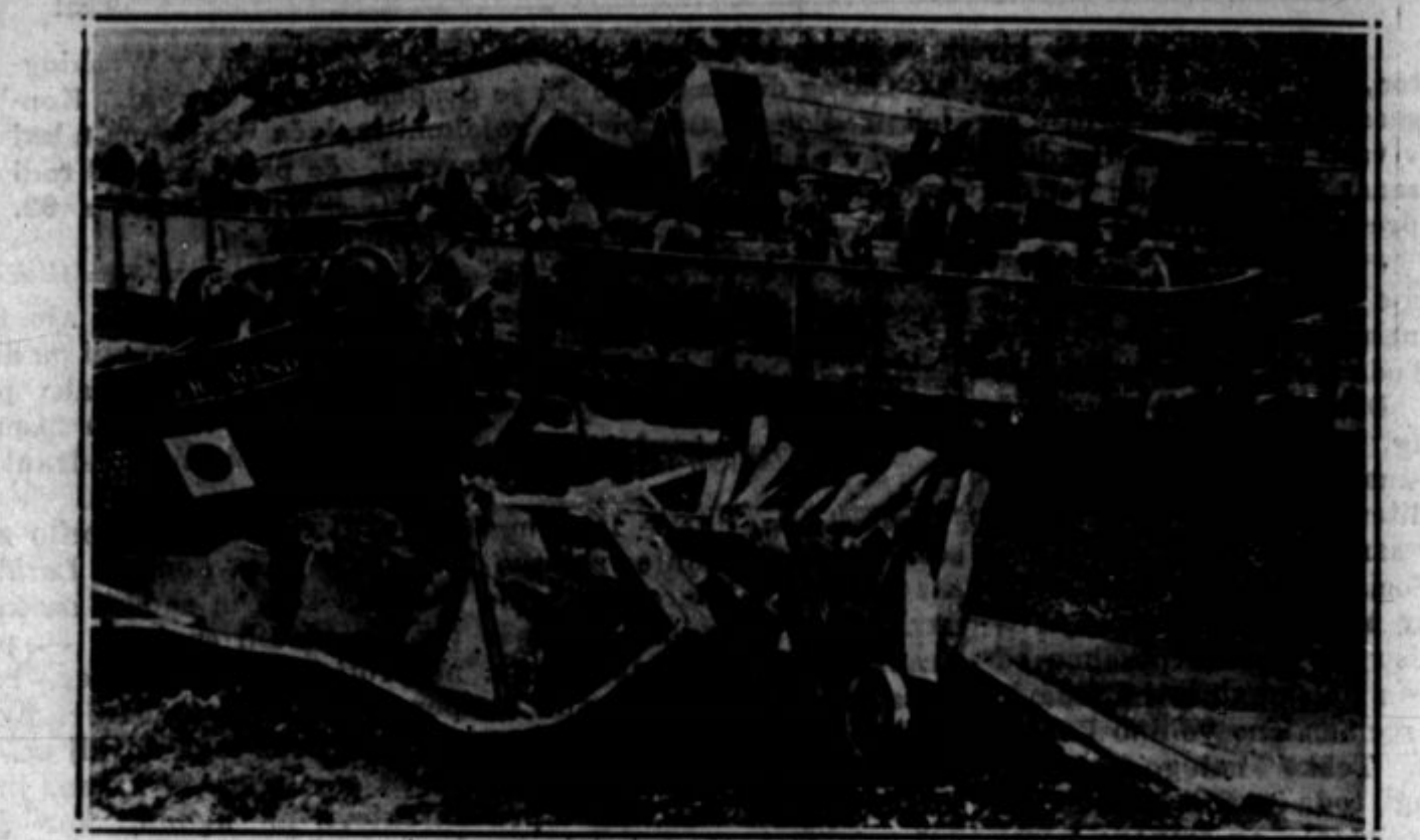
Blizu Deansa v New Jerseyju se je v začetku tega meseca dogodila železniška nezgoda, kakršne so bile pred leti zelo pogoste. Tovorni vlak je vsled kosov premoğa na tračnicah skočil s tira in se prekucnil. Kmalu za njim je pridrvel brzovlak, ki ga strojevodja, ne opazivši nesreče dovolj začasno, ni mogel ustaviti. Potniški vozovi z lokomotivo vred so se zagozdili med tovorne vagon e . Osemindvajset potnikov je dobilo težke poškodbe in dvajset je bilo lahko ranjenih.