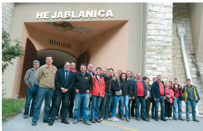
Udeleženci ekskurzije pred vhodom v hidroelektrarno

Člani OOO Logatec in OOO Vrhnika so se med 18. in 20. oktobrom odpravili na kratko ekskurzijo po delu Bosne in Hercegovine. Cilj je bila dolina Neretve s svojimi elektrarnami in mestom Mostar ter bližnjim romarskim svetiščem Medžugorje. Na poti domov so se ustavili še v Drvarju in na slapovih Une. Imeli so se zelo lepo.