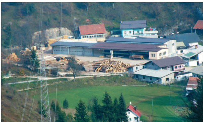
Žagarski obrat podjetja Elvipo d.o.o.

Leta 1995 je bila na vrsti prva večja investicija: nova hala in strojna oprema. Takrat sem tudi začel zaposlovati. V naslednjo investicijo me je leta 2003 gnalo vse večje povpraševanje po boljših in kakovostnejših izdelkih. Nabavljena oprema je računalniško vodena. Leta 2008 je sledila investicija v posodobitev opreme za pripravo hlodovine.