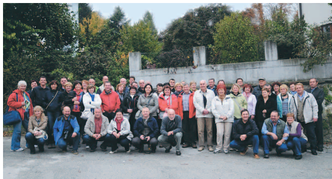
Udeleženci jesenskega potepanja po Avstriji in Nemčiji

Na jesenski izlet v Salzburg, Passau in Linz smo se z avtobusom odpeljali 20. oktobra. Vreme nam je bilo zelo naklonjeno, posebno prvi dan v Salzburgu, kjer smo se po ogledu mesta in Mozartove rojstne hiše z zobato železnico povzpeli do mestne trdnjave in izza obzidja občudovali mesto ter okolico še iz ptičje perspektive. Passau, kjer smo prenočevali, se je pokazal kot mirno, manjše mesto, ki ga zaznamuje sotočje treh rek. Drugi dan smo se z rečno ladjo zapeljali po Donavi. Plovba po reki je bila zanimiva. Občudovali smo v jesenske barve odeto naravo, mala naselja in mesta ob vodi, ki smo jih puščali za seboj ter spoznali, kako mogočne so vodne zapornice na Donavi; njihov sistem omogoča prehode ladij mimo hidroelektrarn in spust ali dvig ladij celo do 13 m. Po prihodu v Linz smo se z vlakcem odpravili na panoramski ogled mestnih znamenitosti in si za konec privoščili še linško torto. Izkazalo se je, da gre bolj za piškot kakor torto, pa vendar, je posebnost mesta Linz. Na poti proti domu smo si samo od zunaj ogledali še benediktinskim samostanom v Kremsmünstru, kjer je nastala tudi fotografija udeležencev.