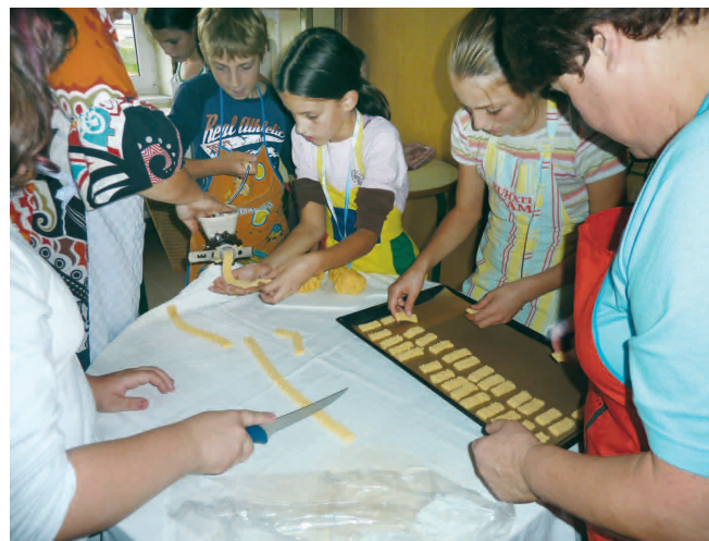
Peka peciva z »Ostrnicami«

»Zavedamo se, da so v obrti in podjetništvu velike možnosti in rezerve za gospodarski razvoj in bodoče zaposlitve, kar še posebej velja za našo občino, kjer je v velikih podjetjih prisotna gospodarska kriza. Predvidevam, da bo v prihodnosti več zaposlitev v obrti in podjetništvu. Do sedaj je potekalo zaposlovanje večine delavcev v večjih podjetjih, tako da je bilo za nekatera strokovna dela težko dobiti določene obrtnike.