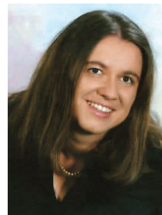
Pripravljala Barbara Grum Vogrin