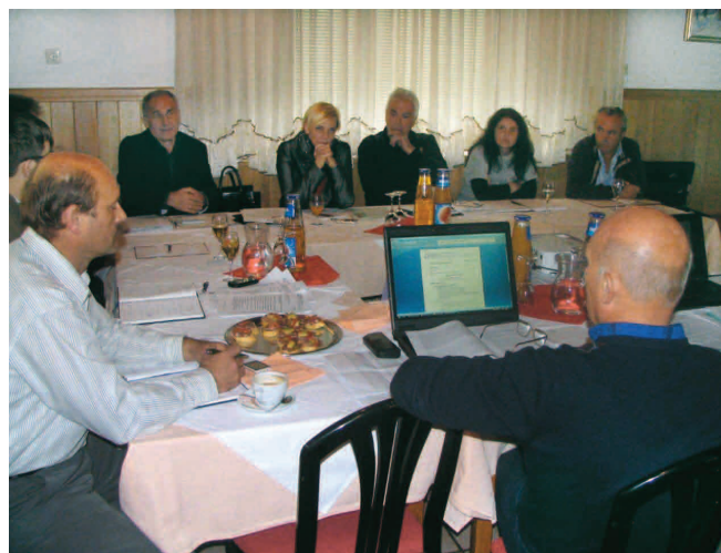
S. seja UO sekcije avtoserviserjev v Podlipi

Nadaljnje delovanje bo odvisno od več dejavnikov, dejavnost pa bo vsekakor organizirana in povezana, saj en gospodarski subjekt kot samostojni podjetnik d.o.o., d.n.o. ali kakšna druga oblika, ne pomeni nič. Skupnost oz. združenost pomeni večjo moč in vpliv.