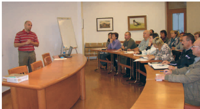
Predavanje o prenosu podjetja na naslednjo generacijo je bilo kar lepo obiskano

Predavanje je bilo zelo poučno za vse, ki si v prihodnosti želijo, da bi svoje podjetje prenesli na potomce. Informacije o predavatelju in njegovem delu najdete na njegovi spletni strani http://www.prenospodjetja.si/ .