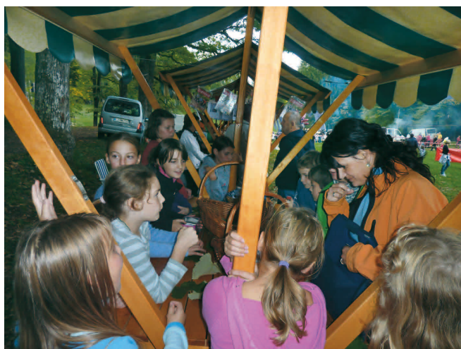
Stojnica krožkarjev UPI na prireditvi Polbarska noč, ki je bila 6. oktobra