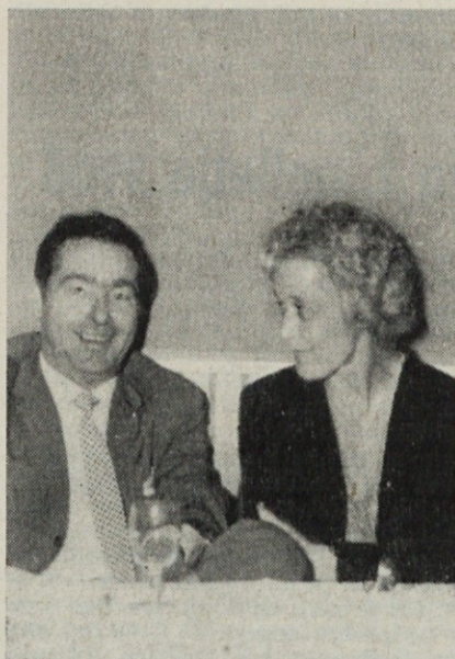
Slovo na delavskem svetu

Zahvaljujem se mu za vse, kar je storil dobrega za podjetje, in mu