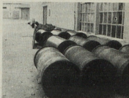
Nastal bo nov stroj