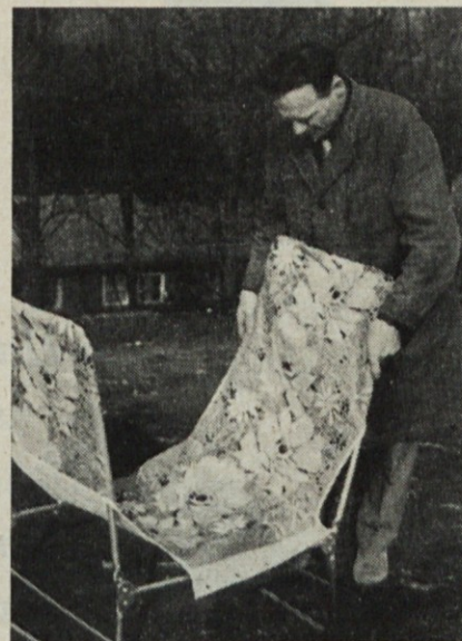
Namestitev platna na camp-ležalnik

Izdaja v 800 izvodih kolektivov tovarne Induplati. Odgovorni urednik Jožo Gagel. Natisnila in klišee izdelala Tiskarna »Jože Moškrič« v Ljubljani