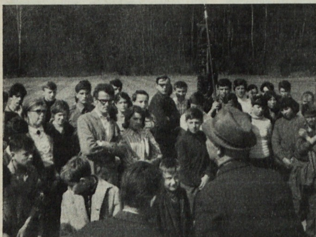
Z mladinskega pohoda na Rudnik

Glede na razna obvestila mero-dajnih forumov bi se moral uvoz tkanin ustaviti ali vsaj omejiti za določeno obdobje. Če se bo to v resnici tudi izvajalo, bo poraba domačega tekstila porasla.