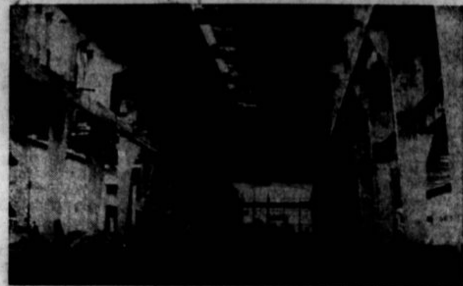
LITOSTROJ, nova velika centralizacija železne in livarske industrije tik Ljubljane.