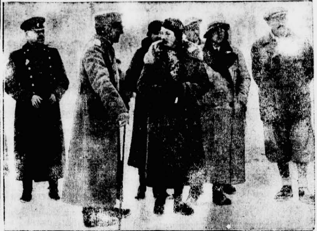
Anlässlich des Staatsbesuches des bulgarischen Herrscherpaares fand bei Batanica eine Hofjagd statt. Das Bild zeigt von links nach rechts S. M. König Alexander, die Fürstin Olga, J. M. die Zarin Johanna, J. M. die Königin Maria von Jugoslawien und S. M. den bulgarischen Zaren Boris.

Dieser Eintauch ist obligatorisch und wird der Finanzminister in diesem Zusammenhange noch ein besonderes Statut erlassen.