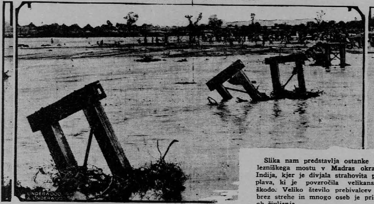
Slika nam predstavlja ostanke železnega mostu v Madras okraju Indija, kjer je divjala strahovita poplava, ki je povzročila velikansko škodo. Veliko število prebivalcev je brez strehe in mnogo oseb je prišlo ob življenje.