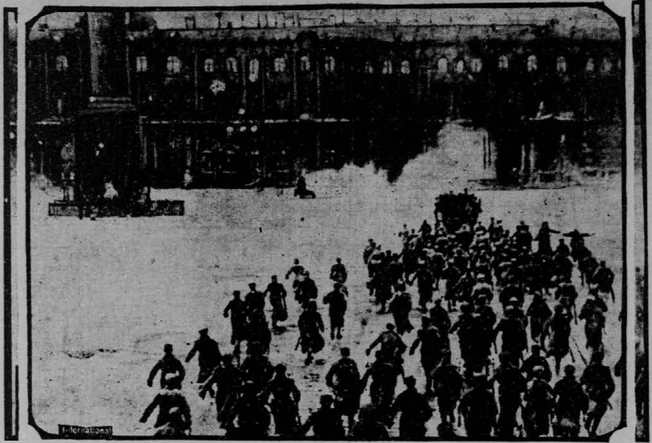
Na sliki vidimo revolucijonarje, ki napadajo zimsko palačo v Petrogradu, sedaj Leninograd. To je bilo pred desetimi leti, ob času velikega prevrata v Rusiji.