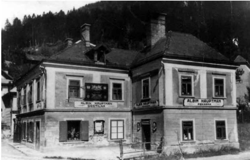
Hauptmanova gostilna (kasneje na tem mestu hotel Korotan)

Gostinski lokali so bili eno od najpomembnejših središč družabnega življenja na Jesenicah, 1 tako do druge svetovne vojne kot po njej. Na prelomu iz 19. stol. v 20. stol. je za Jesenice nastopil velik razcvet, pospešen razvoj železarstva in močno priseljevanje prebivalstva. Hkrati s tem so se pričele množiti tudi gostilne, točilnice («pajzlni», «pajzli»), kavarne, restavracije, hoteli.