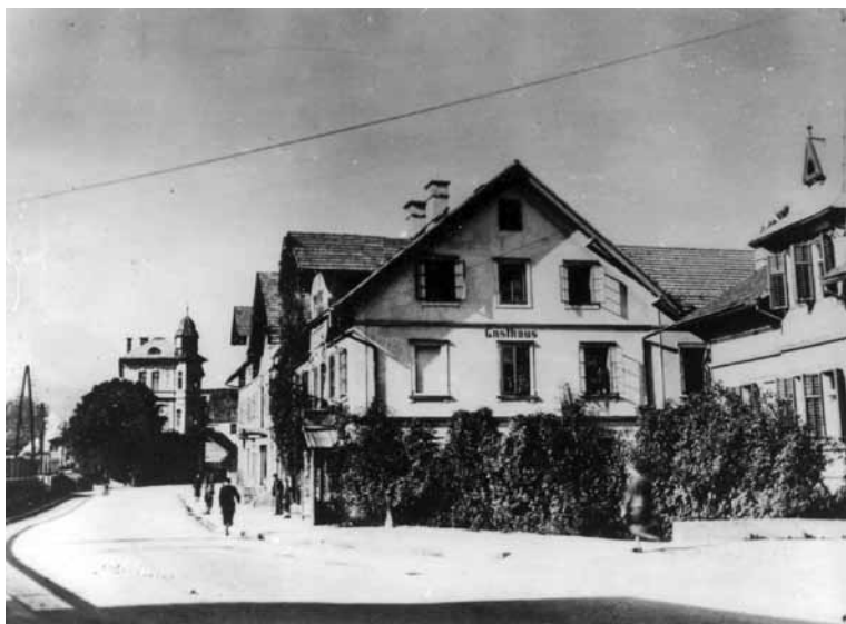
Tančarjeva hiša, v ozadju hotel Triglav