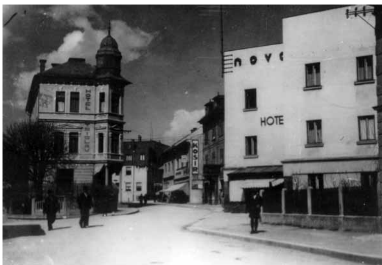
Desno hotel Korotan, levo hotel Triglav