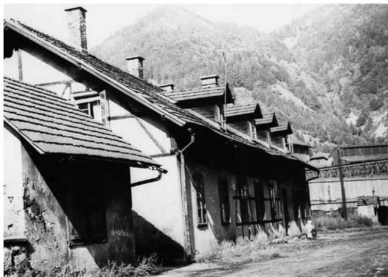
Poslojpe stare kantine

obleki nataknila stotake in tisočake ter se tako dala fotografirati. 28,29