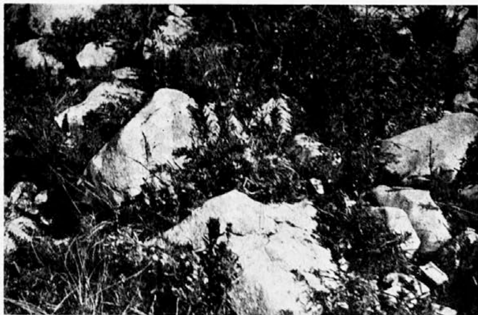
O žepkovem medenju v Liki smo že mnogo slišali: Takale je ta medovita rastlina v svojem naravnem okolju