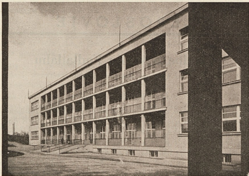
Poslopje za bolehne otroke.

V oddelkih za otroke so sledeči prostori: za otroke, ki so po bolezni ali radi bolehnosti potrebni nege pod zdravniškim nadzorom; nega se vrši po najnovejših izkustvih zdravstva s točnim opazovanjem otrokovega stanja. Nadaljni oddelek za otroke je karantena z oddelkom za nalezljive bolezni. Da šolski otroci, ki so tukaj včasih