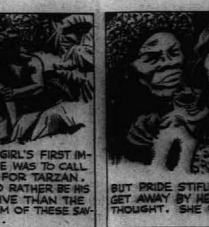
BUT PRIDE STIFLED HER CRY. SHE'D GET AWAY BY HER OWN EFFORTS, SHE THOUGHT. SHE WAS WRONG!!