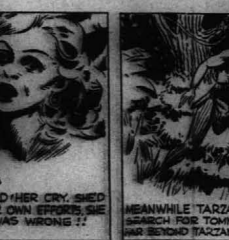
MEANWHILE TARZAN RESUMED HIS SEARCH FOR TOMMY. AT THIS MOMENT HE WAS BEYOND TARZAN'S POWER TO AID HIM.