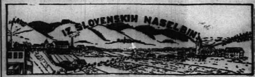
SLOVENSKE DUŠE REŠITE!

Pri razmerah, kakršne so danes, se vi prijemate le za kozjo brado, in tudi jaz sanjam le o isti kozji bradi, toraj lahko razpravljamo akademično, ni pa treba, da bi se drug drugega obmetavali s kako prismojenostjo.