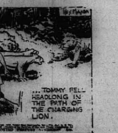
Tommy je padel naprej nedaleč od napadajočega leva.