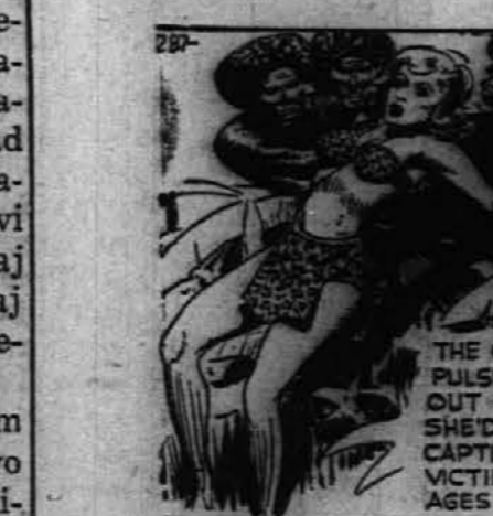
THE GIRL'S FIRST IMPULSE WAS TO CALL OUT FOR TARZAN. SHE'D RATHER BE HIS CAPTIVE THAN THE VICTIM OF THESE SAVAGES.