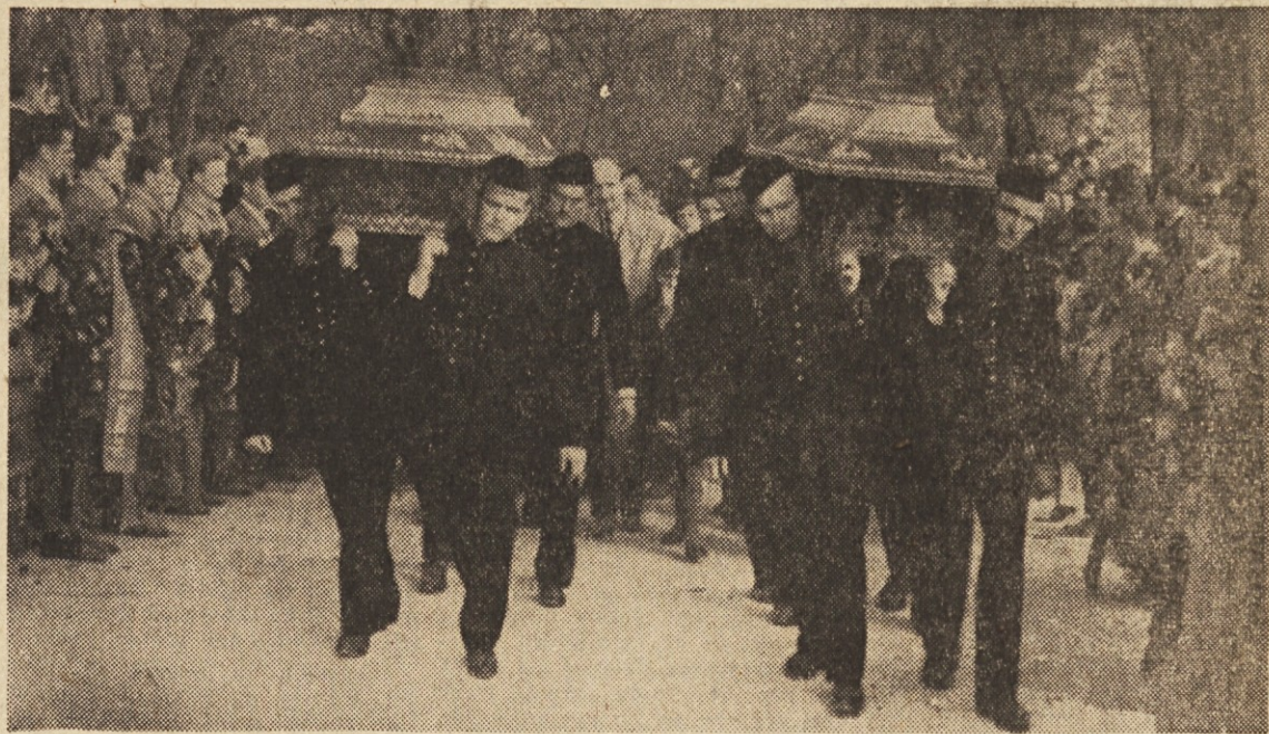
Ponesrečene delovne tovariše so v pogrebni povorki nosili zagorski rudarji, oblečeni v svečane rudarske uniforme