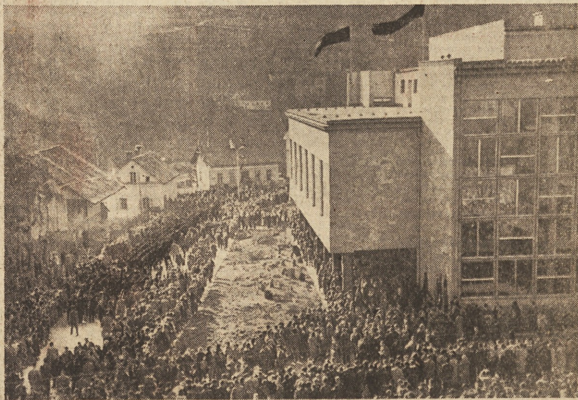
Pred Delavskim domom v Zagorju se je zbrala množica Zagorjanov in okoličanov, da bi tragično preminule rudarje pospremila na zadnji poti

Zagorski rudarji ne bodo nikoli pozabili na ponesrečene tovariše. Delavski svet podjetja, ki se je na dan zadnjega slovesa od preminulih članov kolektiva sestel na žalni seji, je družinam ponesrečenih rudarjev odobril posebno gmočno pomoč. V sklad za pomoč družinam ponesrečenih rudarjev so doslej prispevale mnoge družbeno politične organizacije, ustanove in posamezniki; med drugim Izvršni svet Ljudske skupščine Slovenije, Centralni odbor sindikata rudarjev in drugi. Razen tega pa se je delavski svet zagorskega rudnika zavezal, da bo, dokler bo potrebno, skrbel za materialne razmere družin ponesrečenih članov kolektiva.