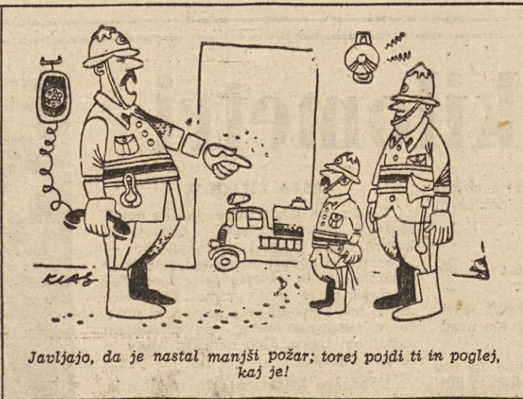
Javljajo, da je nastal manjši požar; torej pojdi ti in pogledj, kaj je!

sapo, v njegovi sobi je zvonil telefon, nekdo si je prižgal cigareto, nekdo se je čehljajal po pleši — sicer pa grobna tišina — dokazuje torej to, da moramo zvišati cene izdelkom...« »Toda...« je skušal ugovarjati tisti, ki se je prej čehljajal. »Nobenega: toda — tovariši! Tu so analize! Tako rekoč matematični dokazi! Podjetje »Cvirm« mora zvišati cene! K temu nas sili poslovna morala do gospodarskega združenja »Strik«, katerega člani smo. Morala je morala, tovariši, in poslovna morala...« V njegovi pisarni je še zmeraj zvonil telefon. Vztrajno. Neopustljivo. Vsiljivo. Ni in ni odnehal. Člani delavskega sveta sprva niso slišali zvonjenja,