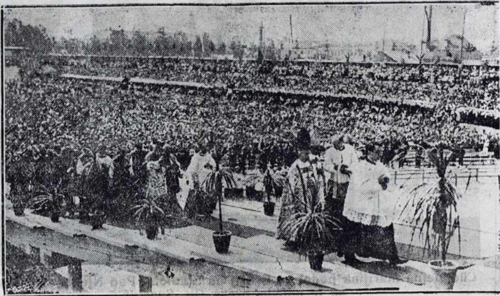
Kardinal-legat, dr. Hlond Augustin, prihaja na Štadion. Vse ga iz celoga srca pozdravla.

Najlepša hvala na rednom pošilanci Vaših listov, štere z veseljom čakam vsaki tjedem. Pozdravljam celo