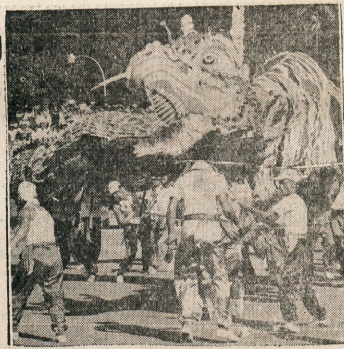
ZMAJ SE UPIRA — Ko so imeli zadnjič svečan sprevod po Hong Kongu, v katerem so nosili tudi "hudega" zmaja, je močan veter zmaja tako "vznemiril", da so njegovi varuhi imeli veliko posla, predno so ga spravili zopet v red. Slika kaže zmajevo glavo in zmajeve varuhe pri razporejanju v sprevod.