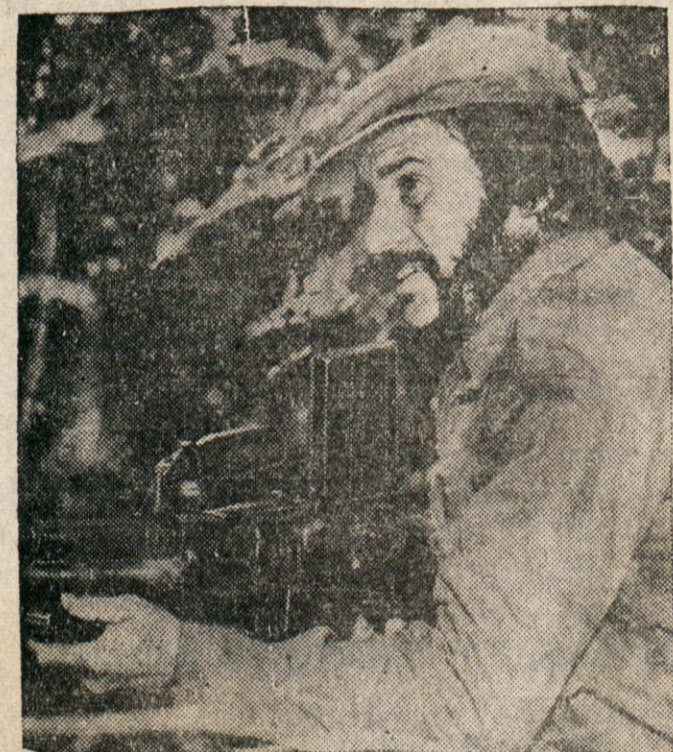
GVERILSKI VODNIK — Francisco Rabal kot vodnik rdečih gverilcev v Boliviji Che Guevara v filmu, ki ga pripravljajo o življenju in delu pokojnega gverilskega vodnika v Latinski Ameriki.