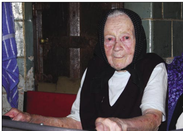
Tetica Mariška so že dopunili devetdeset lejt, dapa dobra vola nji je nikdar nej tanjala

- Kak se tisti tau zové, gde ste vi doma bili na Seniki?