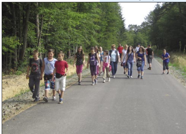
Odpravili smo se tudi na pohod, in to po novi povezovalni cesti med Verico in Senikom

poslušali različne pravljice, potem so zalepili risbe iz kreppapirja, izrezali morske živali in sestavili morskou slikou. Delo je bilo za učence zanimivo in uspešno.