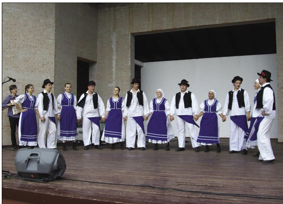
V folklorni skupini Zveze Slovincov z Gorenjoga Senika pleše dosta mladih. V Budimpešti so plesali porabske in prekmurske plese

Da so skupine zgotauvile s svojim programom, se ja začnila pogostitev v šatori. Mislim, dobro je spadno obed folklori, vej so pa rano sedli na bus, pijača je pa malo nazaj dala mauč.