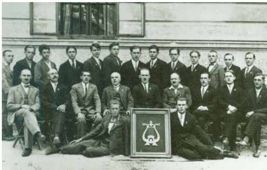
Moški pevski odsek društva Bodočnost leta 1934