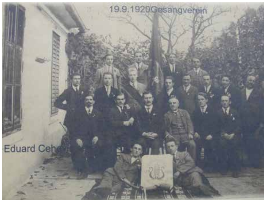
Pevsko društvo Bodočnost Štore leta 1920