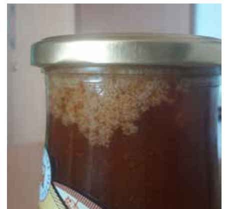
Kristaliziran med – »cvet«

Različne recepte za pripravo jedi iz medu najdete v elektronski knjižici Jedi z medom od tu in tam, ki je dosegljiva na spletni povezavi http://www.czs.si/Upload/files/Jedi%20z%20medom%202019%20last.pdf