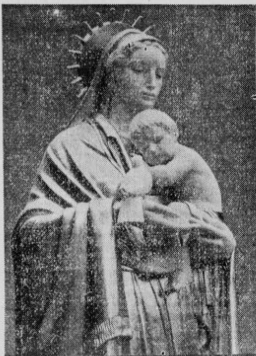
Božidar Pengov: Madona z Jezusom za turisticke kapelo Vzajemne zavarovalnice v Ljubljani.

Ta dela mlada umetnika močno priporočajo. Škoda, da ob sedanjih stiski cerkve ne zmorejo naročil; še bolj škoda, da se po naših cerkvah širijo kiparska in slikarska dela brez vsakršne umetni-