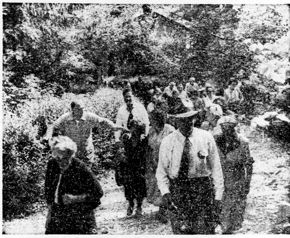
Izlet izseljencev k slapu Savice

Kartum, 2. sept. (AFP) Uradno poročajo, da se je dvojce častnika in 300 vojakov, ki predstavljajo zadnje enote uporniških sil z juga umaknili, v pragozove vzhodno od pokrajine Equatoria. Včeraj se je vrnilo 57 uporniških vojakov in 2 častnika v Torit, kjer so se vdali oblastem. Področje je težko prehodno, planine v teh krajih so visoke do tri tisoč metrov