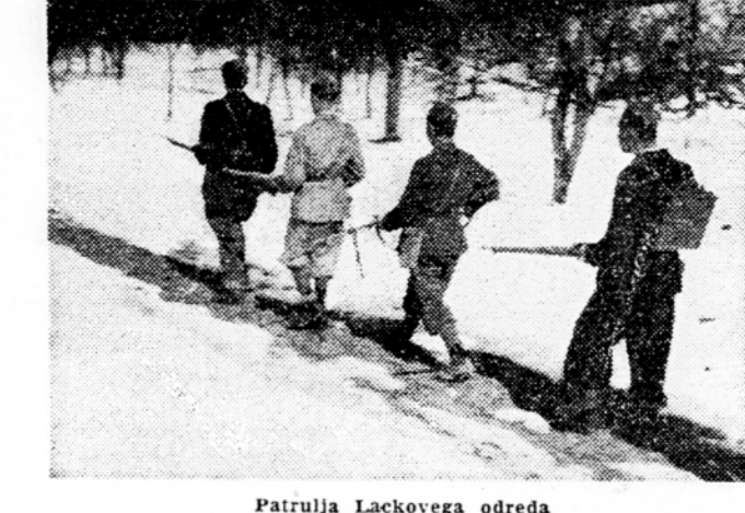
Patrolja Lackovega odreda

Cim se je zjutraj dvignila me-gla, smo opazili, kako se pomika po grapi iz Sobote proti Mlakam dolga kolona. Kmalu po dvanaj-sti uri pa je iznenada zaropotalo nad nami avtomatično orožje. Takoj smo si bili na jasnem, da se je vnela borba na položajih II. bataljona, ki je taborni do-brih 500 metrov nad I. bataljo-