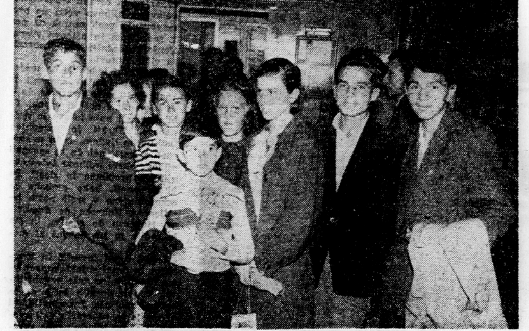
Na zemunsko letališče je l. sept. pripelje osem otrok padlih jugoslovanskih borec, ki so bili pod drugo mesec gosti Mednarodne zveze bivših borec v mednarodnem otroškem taborišču pri Toulouseu v Franciji.