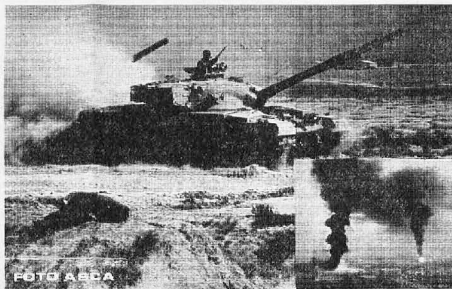
Grmenje topov in eksplozije letalskih bomb so zajeli območje Perzijskega zaliva, kjer je Irak sprožil nesmiselno vojno zoper Iran v upanju, da bo spopad kratek in za Irak zmagovit. Toda razvoj dogodkov kaže, da je na obzoru dolga vojna izčrpanja