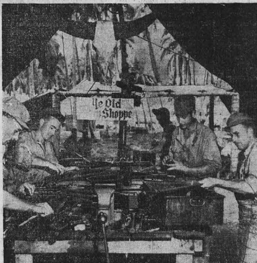
In "Ye Old Gun Shoppe," part of an ordnance unit attached to the 32nd division in New Guinea, all size small arms are repaired by trained ordnance men. The unit does light and medium maintenance work, repairing everything from large artillery pieces to the smallest watches. This is one of the first units to be set up as the troops move ahead.