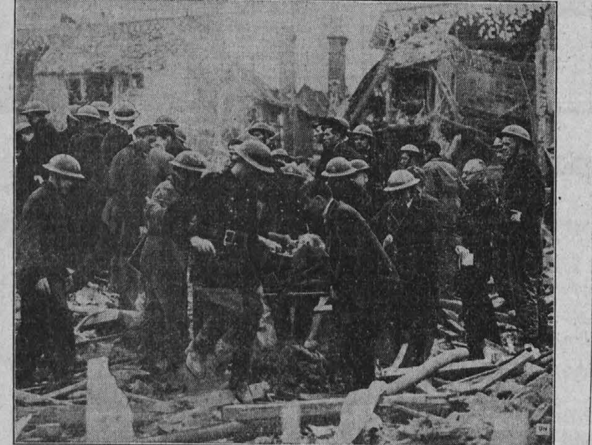
A FEW MINUTES AFTER a robot bomb had exploded in this row of houses "somewhere in southern England," civil defense workers—including women—were on the spot to save lives, quench fires, clear wreckage, restore any essential services damaged. This was the result of only one of the 5340 robot bombs launched by the Germans up to August 2. The woman was dug out of the wreckage and is shown being carried to an ambulance over the remains of her home.