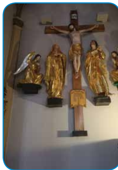
Pozlačeni oltar v cerkvi

Nej zaman smo vōro pa pau odli, dapa če bi vse steli redno pogledniti, te bi nam eden den nej dojšo. Pred obedom smo še odli po varaši, po glavnom trgi pa smo si poglednili cerkev, stera je tō ovakša kak pri nas, cejli oltar pa vse svetniki so pozlačeni bili.