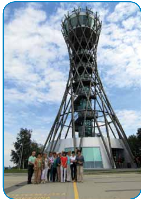
Špageti, štücek ali košara - aj se vsikši sam odlauči

»Šteri je največji štücek v Sloveniji?« bi leko za hejc pitali, vejpa v knjigaj piše, ka 'vinarium' latinski ne znamenüje nika drüggoga kak 'vrč za vino'. Tau ime nosi visiki törem v goricaj blüzi Lendave, šteri se zdigava na bregej,