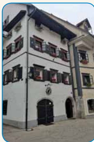
LJUBLJANO LEKO ... stran 8