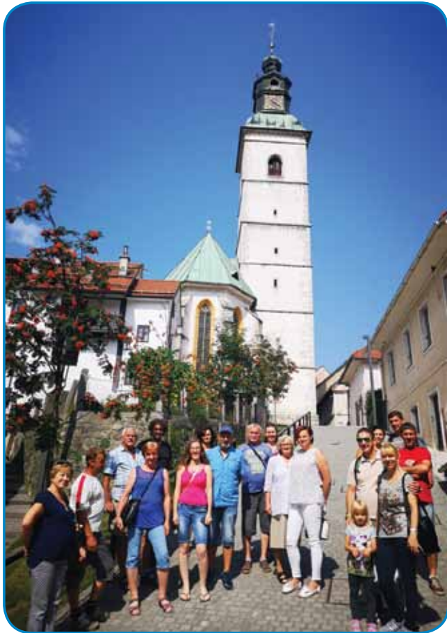
Andovčarge pri škofjaloški cerkvi

tau kak glavnejk delajo, jaslice, iz lesa spletene, vse pükše, ka so nūcali v drügoj svetovnij bojni, dosta taši pavarski škirov, ka se je pri nas sploj nej nūcalo. Vidli smo razstavo slik o škofje-loškem pasijonu. Telko vsega, ka ranč taprajti človek ne vej,