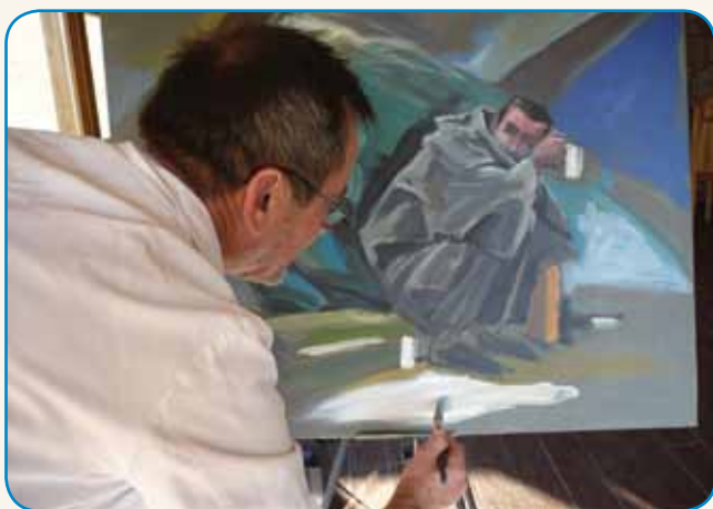
SREČEN JE, VEJ PA DELA TISTO, KA GA VESELI stran 4