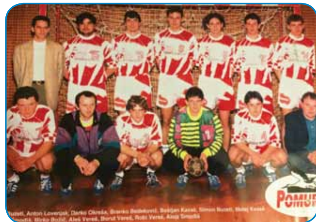
Trener mladih rokometašov (stogi prvi z leve)