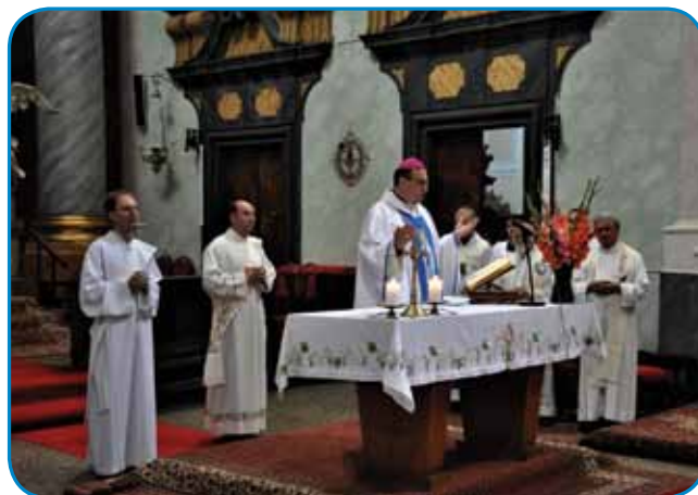
Pri sveti maši v monoštrski cerkvi Marijinega vnebovzetja