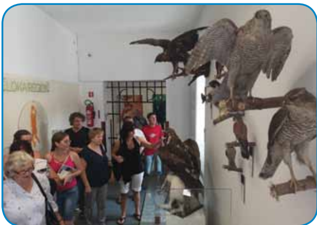
V muzeji smo vidli dosta zanimivoga

ka si tau leto Škofjo Loko poglednemo. Zatau smo že rano mogli staniti, vejpa več kak dvejsta-