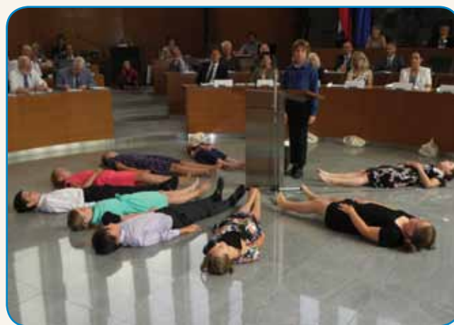
NE SAMO POLITIKA, TUDI KULTURA, PREDVSEM PA DRUŽENJE stran 10