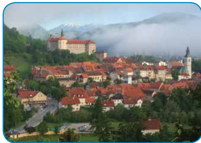
Lejpa panorama najstarejšoga varaša v Sloveniji

upetdeset kilomejterov smo se mogli pelati. Pet minutov prvin, kak bi andovski zvaun šesto vōro vdaro, se je mali avtobus, steroga smo od podjetja Petek iz Kuzme naraučili, stavo pred njim. Te je še vsakši malo zasp-