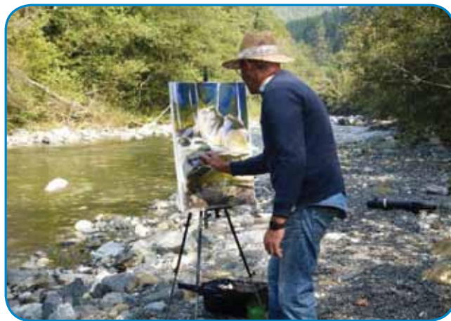
Trno rad odi na likovne kolonije v Bosno

paperi. Vzeu sam jih in jih vse pomalo s farbami, stere so ostale od farbanja domanjoga plota. Te sam večkrat čüu, ka so lidge pravli, ka