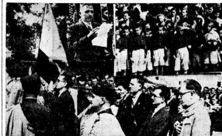
Kum zastave ljubi zastavu prilikom predaje; u ovalu: starešina čete pozdravlja goste; delegati i sokolska omladina

Lep je utisak ostavila prisna saradnja sokola u tome kraju. Na svečanosti su se našli sokoli iz Starog Sivca koji su došli u povorci sa 12 konjanika i 40 biciklista iz udaljenosti od nekoliko kilometara predvođeni od fanfare naraštajaca Sok. društva Kula. Sokolski džez iz Crvenke razveseljavao je omladinu celo posle podne sviranjem narodnih kola i pesama. Odličan utisak ostavio je pevački zbor „Isa Bajić” iz Kule.