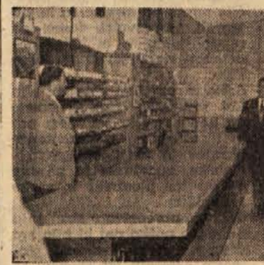
V Kolodvorski ulici v Ljubljani so v palači »Žito-Moka« odprli sodobno urejen lokal, v katerega se je ob svoji petletnici vselilo trgovsko podjetje »Milinar«.