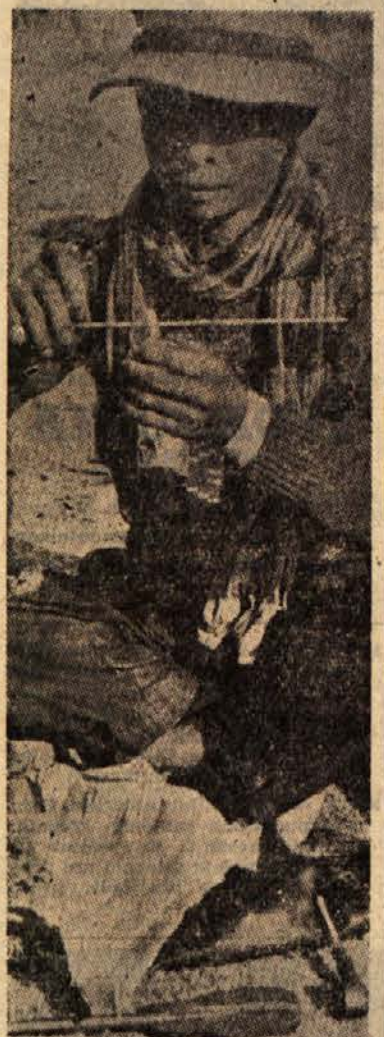
Vaški trgovec ima pred seboj majhno kepo v papir zavitega opija, ki ga kar s škarjami odreže zaželeno količino in jo stehta. Za pet gramov opija je pripravljen vzeti drobič, nad pet gramov pa je treba plačati s srebrnimi kovanci

Ze pred drugo svetovno vojno se je takratno Društvo narodov trudilo, da bi spravili pod nadzorstvo proizvodnjo opija opeposod po svetu. Združeni narodi