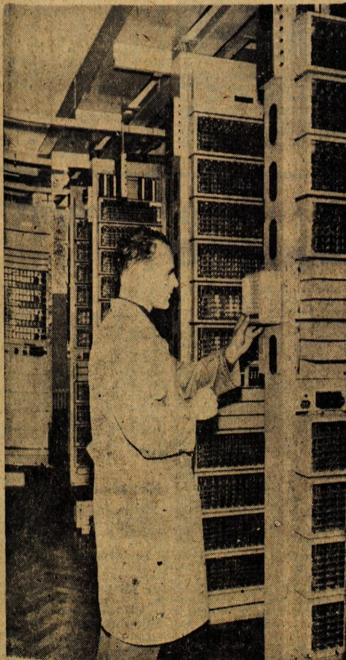
V petek bodo v Radovljici spustili v promet novo telefonsko magistralo od Ljubljane preko Kranja in Radovljice do Jesenic. S tem bo gorenjska popolnoma telefonsko avtomatizirana. Na sliki avtomatska telefonska centrala v Radovljici, kjer bo eno izmed glavnih vozlišč te magistrale

Na Jesenicah je bil na predvečer 1. maja koncert jeseniške in javorške Svobode, potem pa je bila v gledališču osrednja proslava. Prav tako so bile proslave in svečane seje tudi po drugih krajih Gorenjske.