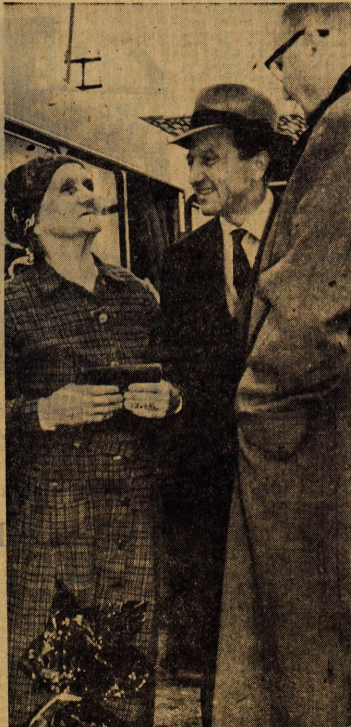
Predstavnika oddelka za fluorografiranje inštituta za TBC Golnik v razgovoru z 82-letno partizansko mamico iz okolice Kozine, ki so ji na njeno veliko presenečenje izročili darilo kot trimilijontemu fluorografiranemu prebivalcu

Honorar po dogovoru. Nastop službe takoj. Ponudbe pošljite na Alpski letalski center Lesce.