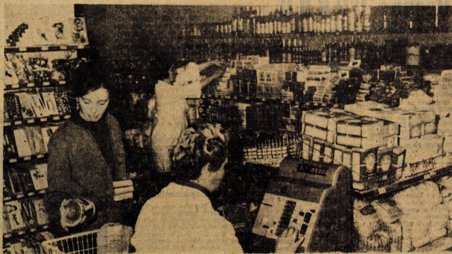
JESENICE, 24. aprila — Trgovsko podjetje Zarja na Jesenicah je od prlo poslovalnico Kašta. Prostor so adaptirali v stari Brnarjevi hiši, tako da so pridobili sodoben lokal z oddelkom za špecerijo in manu fakturo. Poslovalnica Kašta je bila prej na nasprotni strani ceste; prejšnje prostore bo železarna preuredila za svoje potrebe

Od vsega ostane le nekaj akcije in inteligentno izvirne likovnosti. Komu naj bomo za to hvaležni? V prazničnem sporedu smo si izbrali priliko ogledati tudi Kozaro. Film poznamo in ga ne bi omenjali, če me ne bi zdesetkana kopija opomnila na nek pojav, ki je zaradi svoje neodgovornosti vreden, da se ga obsodi. Projekcija je zaradi manjkajočih ali bistveno skrajšanih sekvenc dobila fragmentarni značaj. Film je postal neozumljiv. Epske vrednote Kozare je bila razvrednotena. Tako neodgovorno priznana umetnina se na naših platnih ne bi smela pojaviti. NK