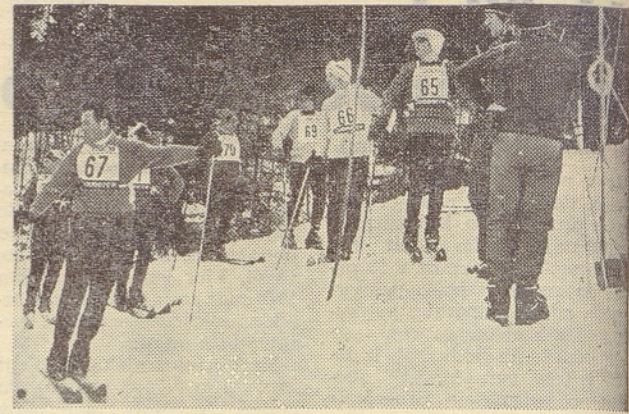
Pred letošnjim startom starejših tekmovalcev