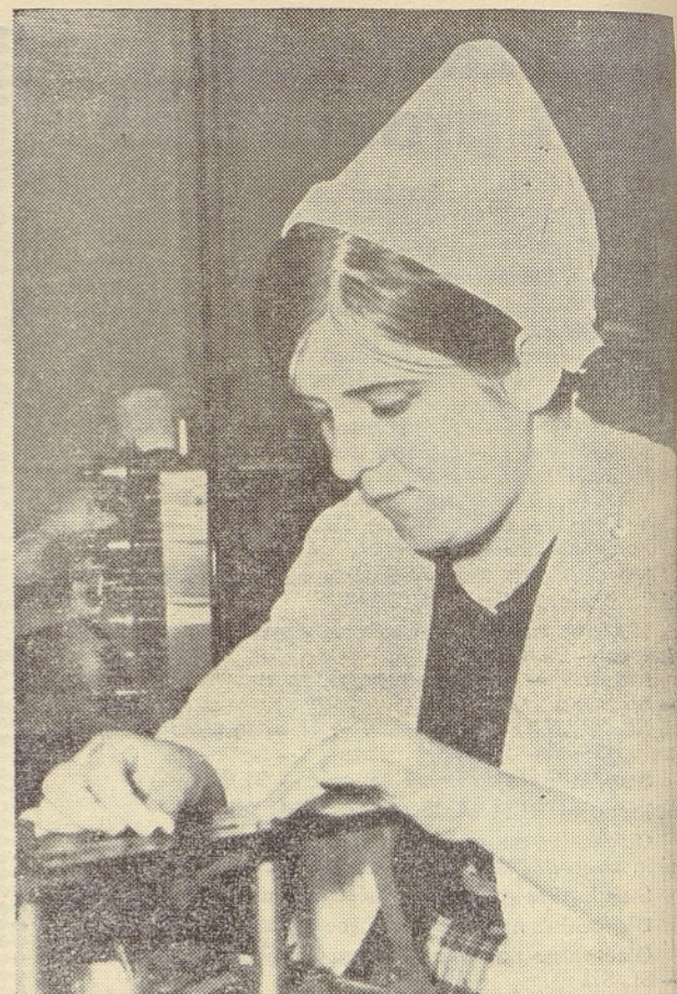
Kolektiv »Kondenzatorji« Semič bo letos praznoval 20-letnico obstoja. Na sliki: detajl iz proizvodnega oddelka