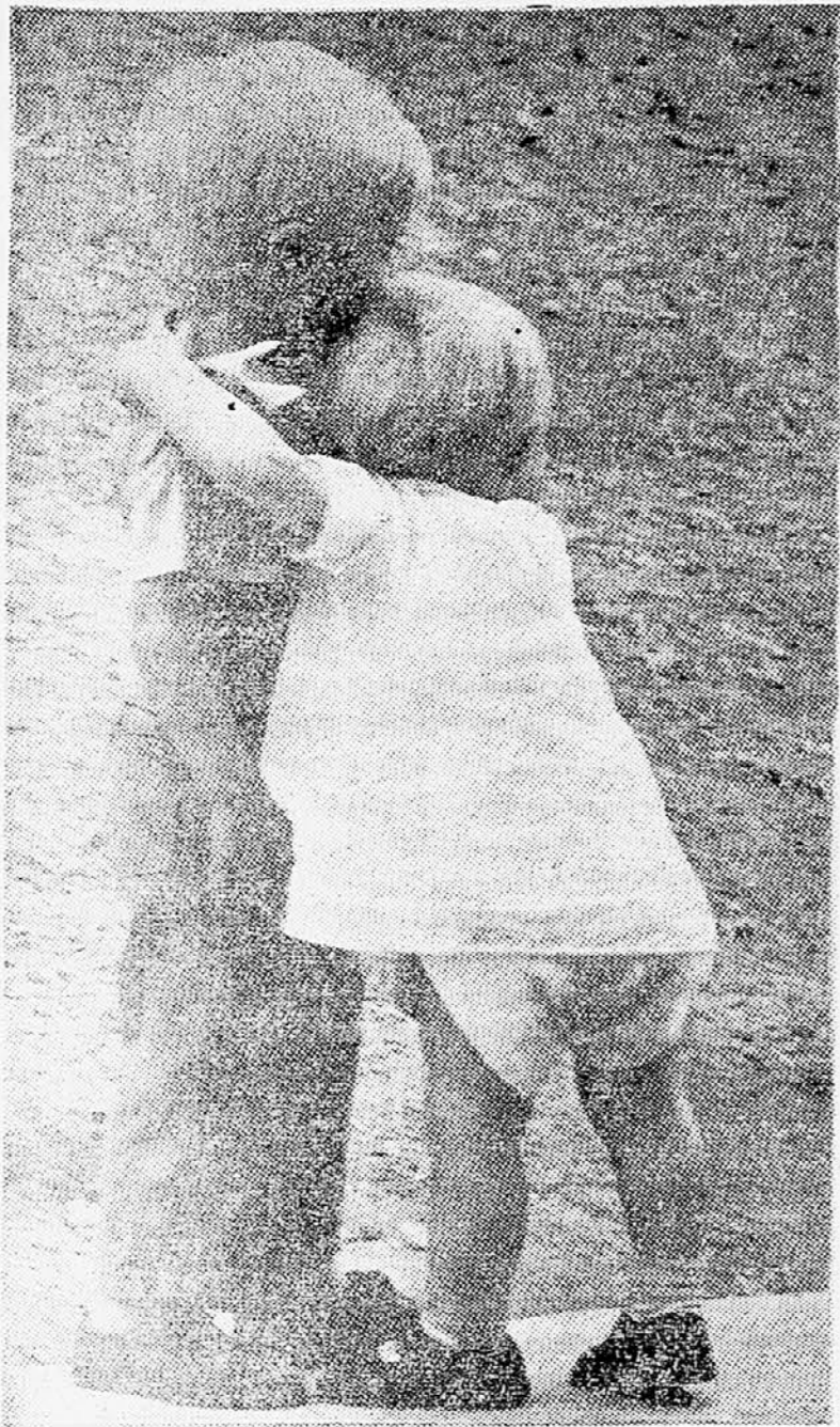
Brani me, saj si vendar fant...!