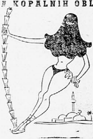
na Srednjem vzhodu