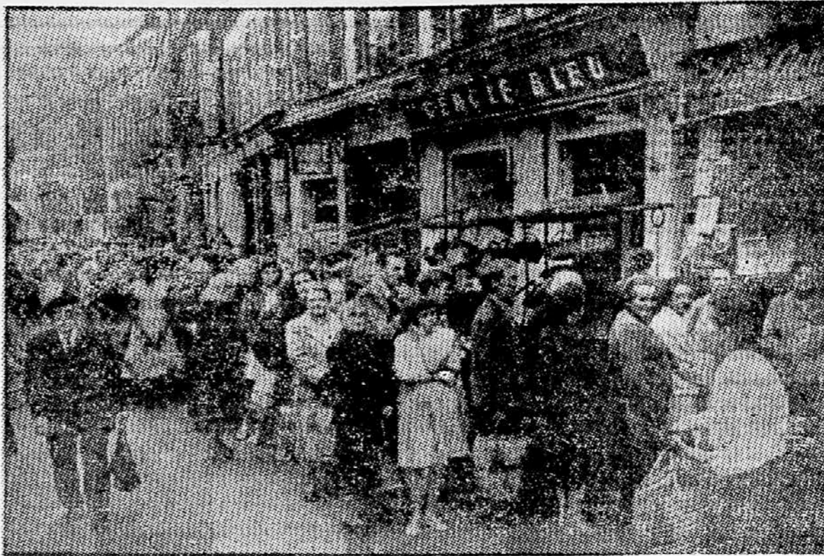
Zadnji dogodki v Franciji so med potrošniki povzročili precejšnjo paniko, kot dokazuje tale rep pred trgovino.

Lizbona, 30. maja. (Reuter) Opozicijski kandidat za predsedniške volitve na Portugalskem dr. Arlindo Vicente je sinoči sklenil umakniti svojo kandidaturu v korist drugega opozicijskega kandidata generala Delgada.