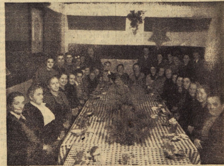
Žene VI. terena so lepo proslavile svoj praznik

Ustanovljeno je bilo 6 druženj Ljudske tehnike. V počastitev OF je bilo izvedenih nad 80 slovenskih množičnih sestankov, kjer se je mladina seznanjala s slavno zgodovino NOV. Mladina okraja Trbovlje je dobila pohval-