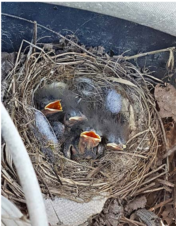
Kak teden dni stari mladiči BELE PASTIRICE ( Motacilla alba ) so dokaz o uspešnem »potujočem valjenju«.

Bela pastirica je ena najbolj prilagodljivih vrst v Sloveniji. V naravi gnezdi med skalami in kamni, vse pogosteje pa izbira človekovo bližino: zidne votline, napušče, garaže ali celo prevozna sredstva.