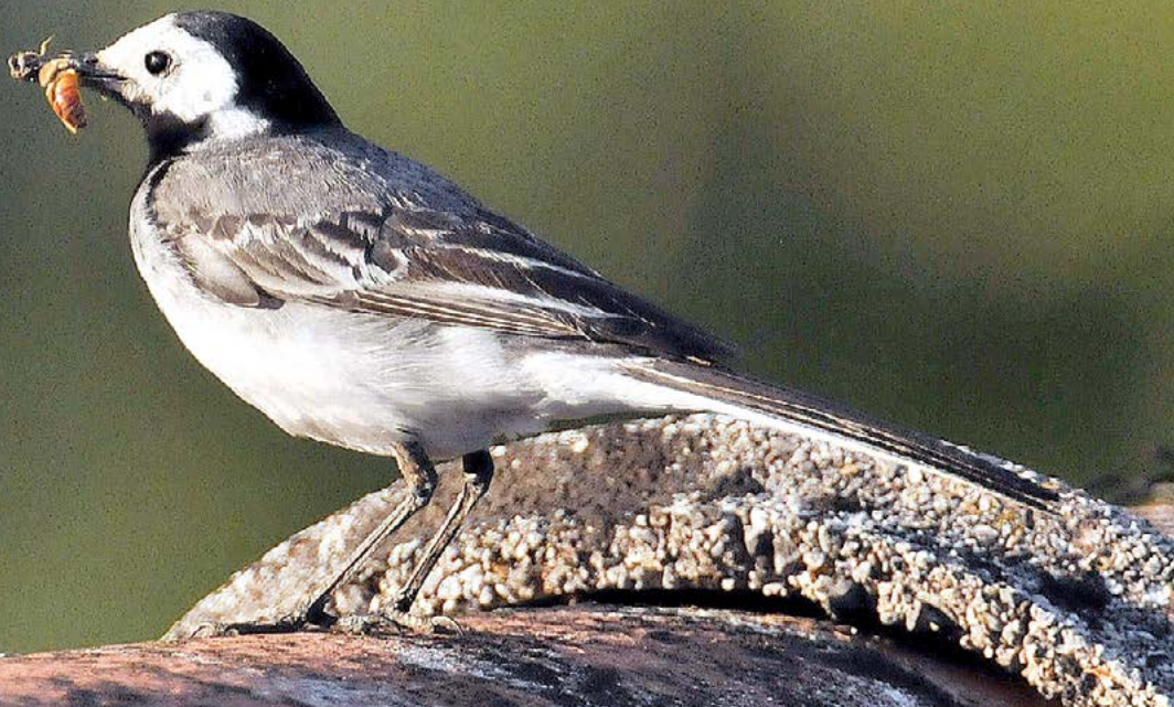
BELA PASTIRICA ( Motacilla alba ) je prilagodljiva vrsta, ki v bližini človeka lahko gnezdi na najbolj nenavadnih mestih.

V življenju ptic ni vse povsem predvidljivo. Pogosto nas presenetijo z vedenjem, ki ga niti izkušeni ornitologi ne bi pričakovali. Ena takih posebnih zgodb je povezana z belo pastirico ( Motacilla alba ), ki se je izkazala za izjemno prilagodljivo in neustrašno.