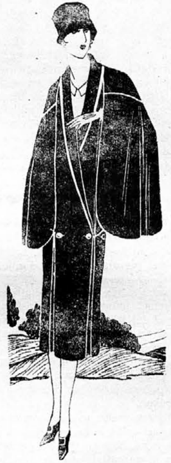
Plaše iz modrega volnenega blaga s srebrnimi trakovi.

nili. Tudi dekolte se ne bo dal tako lahko popolnoma izpredriniti. Nizka tajla pride v kratkem iz mode. Tudi pri plaših opažamo spodaj razširjenje v obliki zvona.