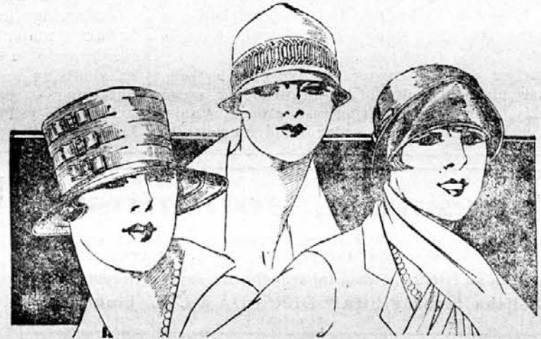
Od leve na desno: Slamnik rožne barve s trakom iste barve in tremi zaponkami iz emajla. — Rjav klobuk s svilenim trakom iste barve in vezane ter zeleno in sivo poslikanim trakom iz crépe de Chine. — Klobuk iz črnega in česnjevodčega traka z bizuterijskim nakitom.