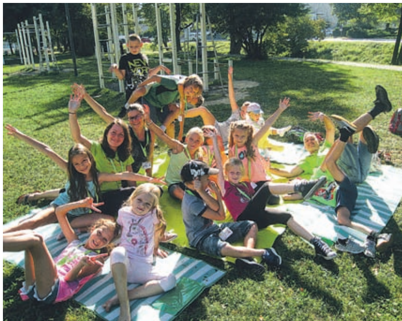
Zadnji počitniški teden so kratkočasili 18 osnovnošolcev, ki so bili radi tako v naravi kot v učilnicah centra. Vsak dan so jim pripravili drugačne igre in športne dejavnosti.