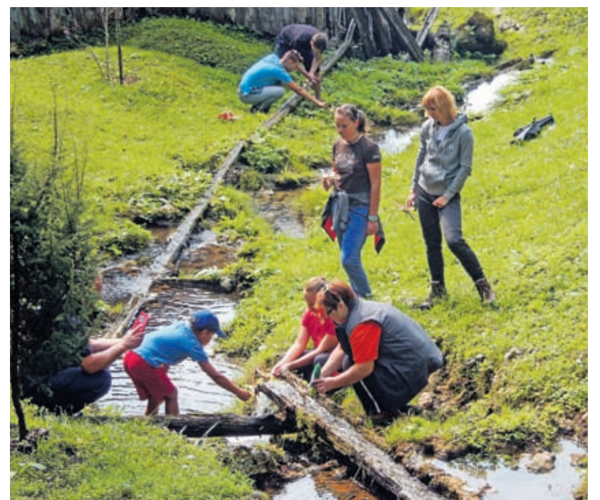
Že prihodnje leto želijo v TD Vinska Gora vzpostaviti »Mlinarsko pot škrata Bisera«. Preizkusili so jo v soboto, ko so mladi zelo uživali v spoznavanju doline mlinov.