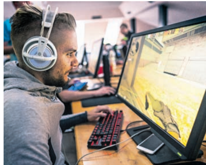
Eni so prišli tekmoval, drugi so se prišli igrat, tretji le opazovat.

drugih koncih Slovenije. To je bilo res lepo videti,« še izvemo. Kot tudi, da bodo isti organizatorji prihodnje leto v velenjski Rdeči dvorani pripravili festival računalništva in sodobnih tehnolo-