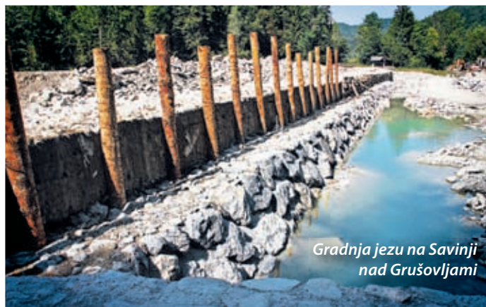
Gradnja jezca na Savinji nad Grušovljami

bila prihodnji mesec) ocenjujejo na 500 tisoč evrov. Denar za naložbo, ki predvideva prenovo in utrditev celotnega temelja jezca, izvedbo novega vrhnjega sloja jezcu z novim podenjem, stezo za prehod vodnih organizmov, razširitev struge nad jezom, izvedbo dveh stabilizacijskih pragov na odseku pod jezom in ureditev brežin pod jezom, bo zagotovila Direkcija RS za vode. ■ tp, foto: jm