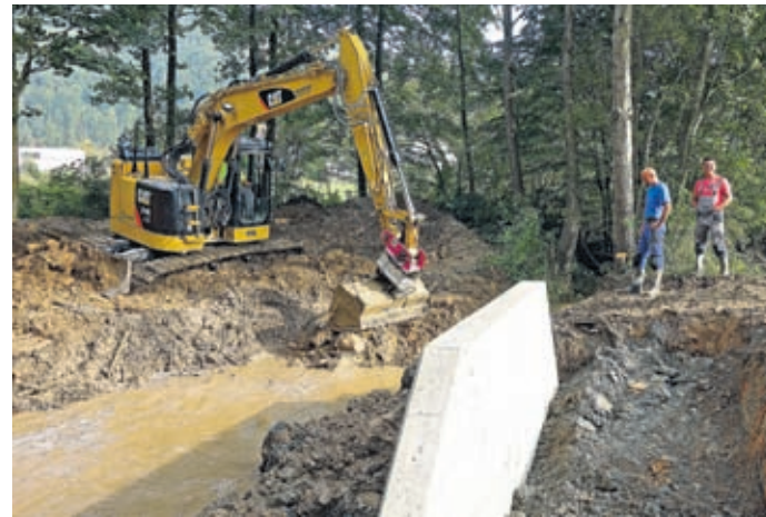
Za kolesarje bosta čez potok Toplica zgrajena dva nova mostova.

Topolšica - Kolesarji, vse več jih je, so že težko čakali na kolesarsko pot od Zagerja do Term Topolšica, ki se jim je odmikala kar nekaj časa. V dolžini dobrega kilometra bo speljana pod gozdom ob potoku Toplica do mestne in krajevne ceste, kjer se nahajajo turistični objekti Term. Kolesarska povezava bo razgibana, potok Toplica bo dvakrat z na novo zgrajenima mostovoma tudi prečkala. Osvetljevala jo bodo svetila, nameščena na dvaintridesetih drogovih. Dela pospešeno potekajo in