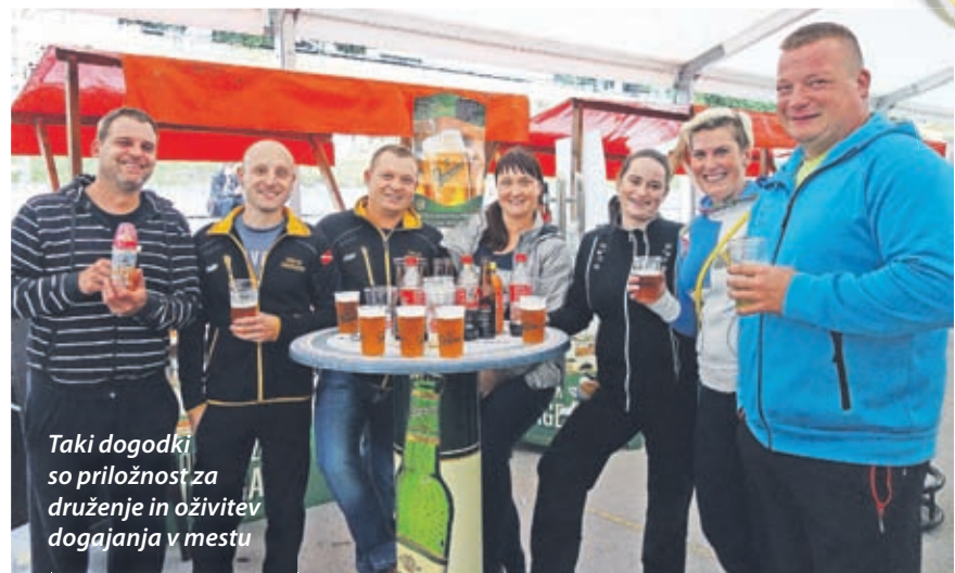
Taki dogodki so priložnost za druženje in oživitve dogajanja v mestu

tako, kot bi bilo, če bi mu kuliše dajal Trg bratov Mravljakov, streho pa nebo, a je bilo kljub temu živo in živahno. Točilo se je pivo, vrtele na ražnju, dišalo je izpod peke, pražen krompir, obogaten s »pasjo radostjo«, so šoštanjski turistični zanesenjaki kuhali, lupili, rezali, pražili, pa spet kuhali, lupili ... Enkrat, dvakrat, trikrat, tolikokrat, kot so to želeli obiskovalci. Ob pivu je šel v posebno slast.