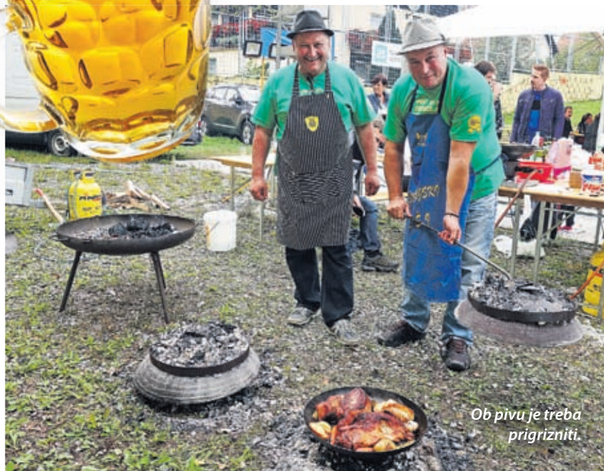
Ob pivu je treba prigrizniti.

venskih piv. »Domači pivovarji presenečajo ljubitelje z nenavadnimi vonji in okusi,« je pripovedovala. »S takimi dogodki jih spodbujamo pri njihovi dejavnosti, želimo jih narediti prepoznavne. Ker pa nismo ozki in vemo, da so odlična piva tudi zunaj naših meja, ponujamo tudi vrhunska piva iz celega sveta.«