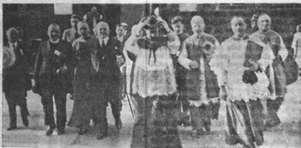
Kardinal dr. Hlond s spremstvom pri prihodu v Ljubljano

Glavne prireditve poleg drugih pobožnosti po cerkvah in Stadionu so bile nočne in podnevne procesije, katerih se je udeležilo preko 40 tisoč vernikov. Vseh udeležencev na kongresu pa sodijo, da je bilo do 100 tisoč, saj so jih dale samo podeželske tace preko 20 tisoč. Kongresa se je udeležila kr. vlada, vojska, vsi jugoslovanski školje, ban in drugi predstavniki civilnih, vojaških in cerkvenih oblasti.