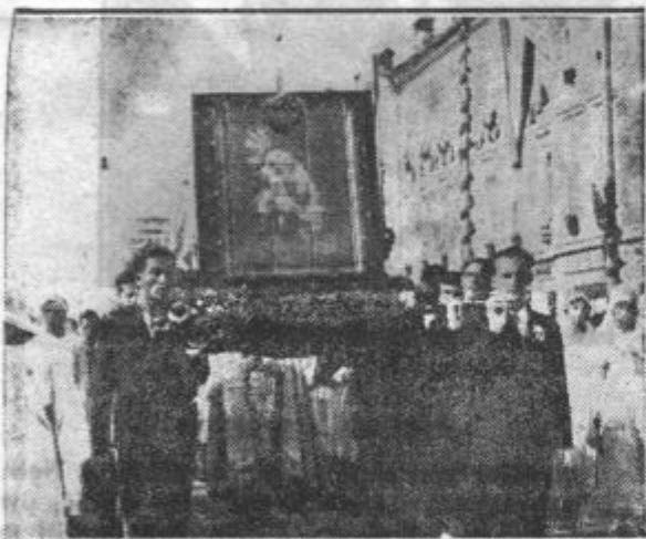
Dvanajst mladih fantov nese čudodelno podobo Marije Pomagaj iz Brezij v procesiji iz stolnice na Stadion

Evharistični kongres v Ljubljani, kot izključno verska manifestacija, bo brezdvomno mnogo pripomogel v pogledu dušernega pomirjenja na našega danes tako demoraliziranega bi se reklo modernega človeka.