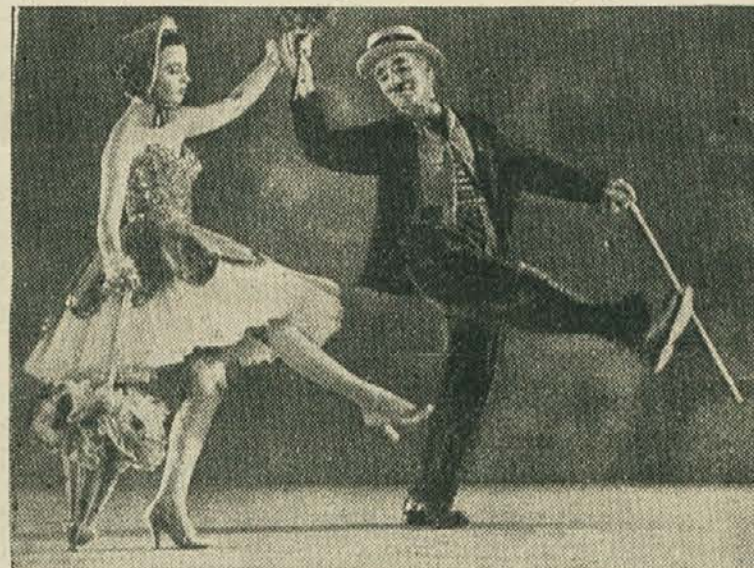
Charlie Chaplin in Claire Bloom

izgubili dragoceno osnovo, ki je vsak teden tisoč do tisoč dve sto mladim obiskovalcem kina vendarle posredovala nekaj uvodnih pojasnil, opozoril in vodilnih misli pred filmom in jih s tem uvajala v sodobno gledanje filma in samostojno razmišljanje o filmu. Sicer je bilo med temi obiskovalci tudi nekaj takšnih — vsaj po mnenju predavateljev — ki se za filmsko vzgojo niso posebno zanimali in so se abonirali predvsem zaradi ugodnih pogojev. Toda prav za te so bili uvodi k filmom, ker so jih pač tudi mo-