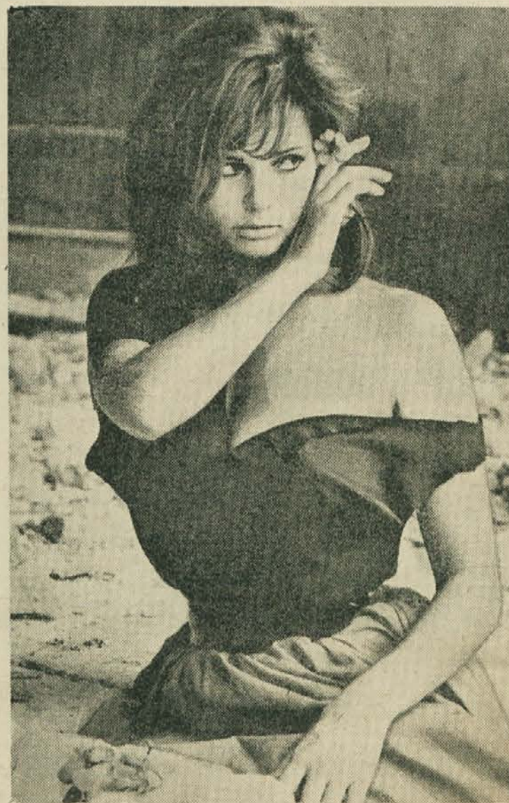
Ali vam je lanskoletna obleka preozka? (Komentar tehničnega urednika P. Kanclerja)

Morda vas bo zanimalo tudi to, da zraste las v enem letu za približno deset do dvajset centimetrov, da izpade pri zdravih laseh dnevno deset do trideset las. Za bujnijo rast las priporočajo uživanje rib in hrane, ki vsebuje jod, nato B-vitamin, žito in predosem zelenjavo, ki vsebuje železo. Boča