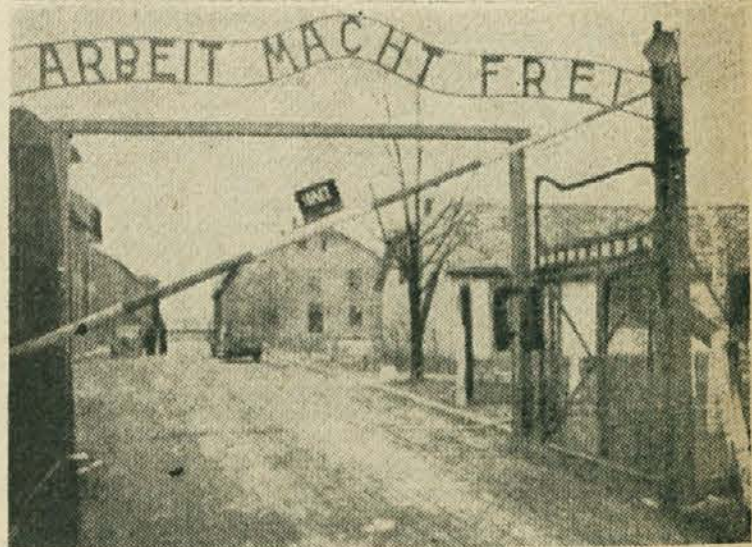
Vhod v taborišče Auschwitz

V tem bloku so gestapovci in esesovci znali uprizarjati najbolj nečloveške metode mučenja. Tu so morali jetniki po končanem delu preko noči stati do vratu v vodi. Imeli so posebne luknje v veličini 90x90 cm, kamor so tudi za 14 dni strpali po štiri osebe, ki so tako po delu morale stoje preživljati vsako noč. Za dihanje so imeli le odprtine s premerom