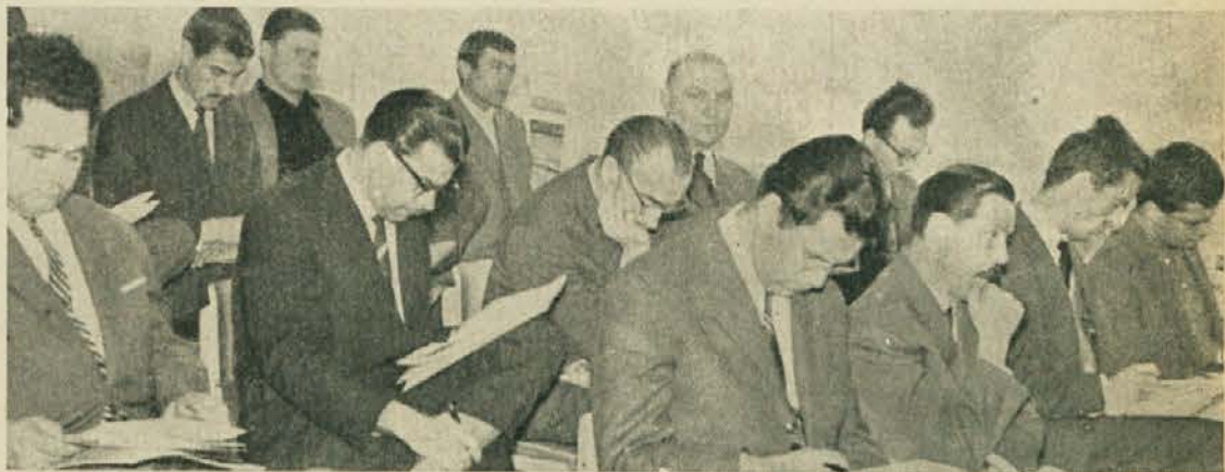
Konferenci so prisostvovali skoraj vsi direktorji mariborskih VS

tistih, ki začasno izgubijo status študenta. Delegat študent VSS je dal dober predlog — uvesti bi bilo treba posebne zdravstvene izkaznice za študente, da nam ne bi bilo treba za vsako malenkost krasti čas sebi in šolskim tajništvo zaradi posebnih potrdil, ki so potrebna vedno znova; v teh izkaznicah bi kazalo uvesti podoben sistem, kot ga imamo že upeljanega pri potrjevanju zavarovančevega delovnega raz-