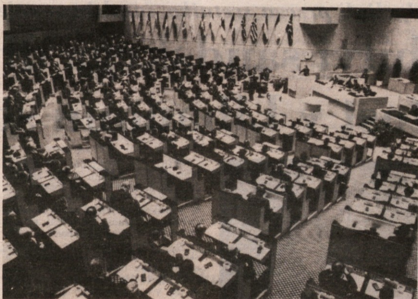
Pogled na dvorano ob otvoritvi stockholmske konference