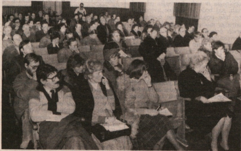
Občnega zbora SKD Tabor se je udeležilo kar zadovoljivo število Opencev