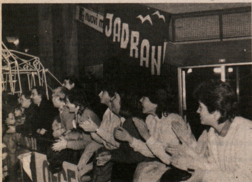
Jadran bo drevi v Repnu (ob 20.30) odigral prijateljsko tekmo proti Canelli iz San Donaja, ki sedaj nastopa v B ligi. Srečanje bo za Žagarjevo moštvo še kako koristno pred sobotnim gostovanjem v Bologni