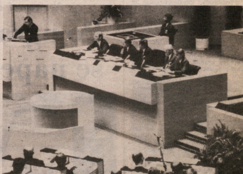
Konferenco je odprl švedski premier Olof Palme