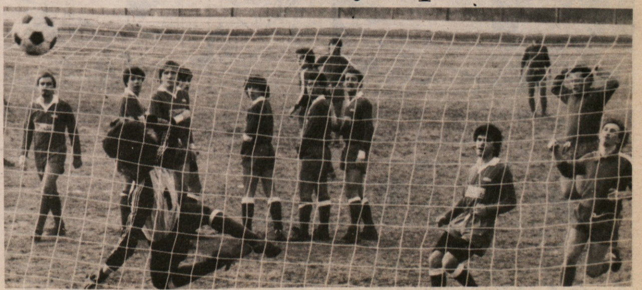
Eua redkih priložnosti Bazovcev za gol med tekmo Zarja - Domio v Dolini