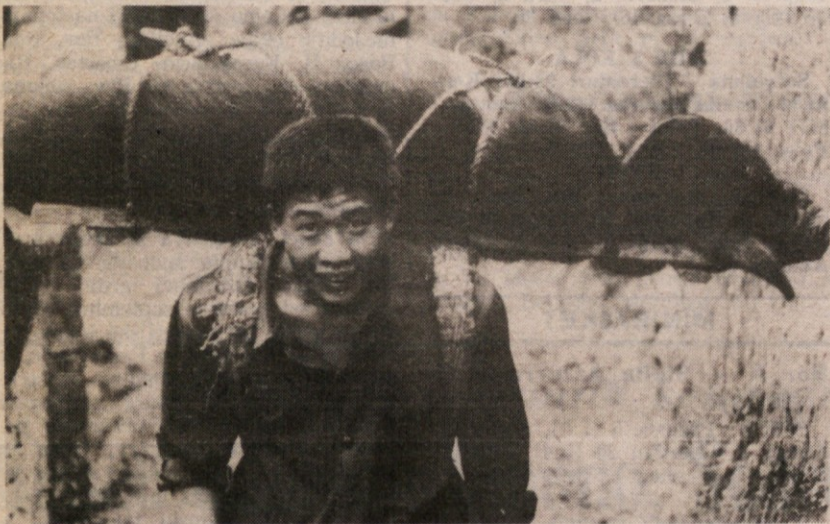
Fotografija je bila posneta v kitajski pokrajini Hubei. Mlad kmet si je natovril na pleča živo svinjo, da bi jo nesel na trg v mesto Gezhouba in jo tam prodal. »Res je težko breme — je priznal kmet reporterju — vseeno pa je enostavneje nositi žival na plečih kot jo vleči in tirati čez gorske prelaze«