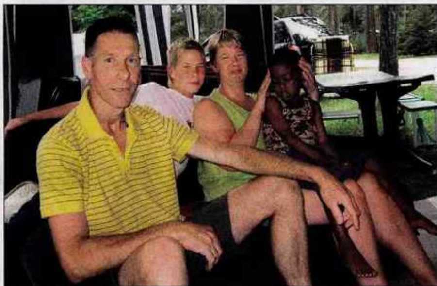
Družina Koolen na Šobcu dopustuje že enajstič.

A družina Koolen iz okolice Rotterdama na Nizozemskem je ena od izjem. Na Šobcu - ne glede na vreme - prihajajo že enajsto leto zapored. "Mož je v Slovenijo s starši prvič prišel pred štiri desetimi leti, ko je bil star sedem let. Zdaj že enajst let prihajamo skupaj z otroki. Letos sta dva ostala doma, dva pa uživata tukaj z nami," je povedala gospa Koolen. Na Šobcu jim je vseč lepa narava in jezero, v katerem se otroci neizmerno zabavajo. Šotor si vsako leto postavijo v bližini igral, tako da sta fanta vedno na očeh staršev. Ker v kamp