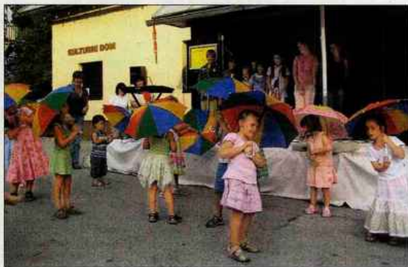
Obiskovalci so navdušeno ploskali vrtečevskim otrokom.

Dogajanje so tokrat raztegnili kar na štiri dni, saj so že v petek v prostorih kulturnega doma pripravili delavnice, v okviru katerih so izdelovali cvetlične aranžmaje. "Naj poudarim, da so za pripravo aranžmajev uporabili zgolj travniško cvetje in cvetje z vrto, nič ni bilo kupljenega," je