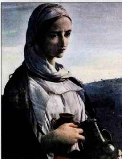
Marija Magdalena s posodicami

Iz češenja Marije Magdale se je v Neročiji v 13. stoletju razvil red magdalenk, namenjen spokornicam in spreobrnjenkam. V ustanove, ki so nosile ime Hiša Marije Magdale, so do 15. stoletja zapirali prostitutke, da bi se v njih naučile spodobnega življenja in dela. Umetniki jo upodabljajo s posodico z mazilnim oljem, stoječo pod križem ali kot spokornico z razpuščenimi lasmi (po zgrešenem enačenju s svetopisemsko grešnico). Včasih ima pri sebi še mrtaško ali hudičevo glavo, spokorni bič, knjigo, trnovo krono. Pripisovali so ji celo serijo zavetništev. Tako drži svojo svetniško roko nad ženskami, študenti, jetniki, frizerji, vrtnarji, vinogradniki, trgovci z vinom, izdelovalci parafumov in pudra. Je tudi priprošnjica pri očesnih težavah, proti slabemu vremenu in zoper mrčes. Priimek današnje godovnice uporabljamo kot osebno ali krstno ime, ki ima mnoge oblike: Magdalena, Magda, Majda, Alenka, Lena, Lenčka in Makalonca.