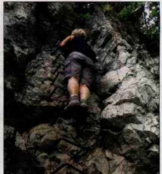
Druga navpičnica, tik pred izstopom iz smeri