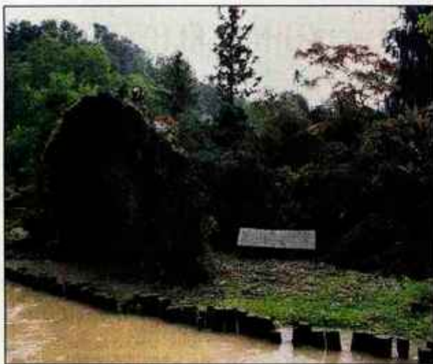
Močan veter je prekucnil smreko na zbirko pahljačastih javorjev ob jezeru rdečega javorja.