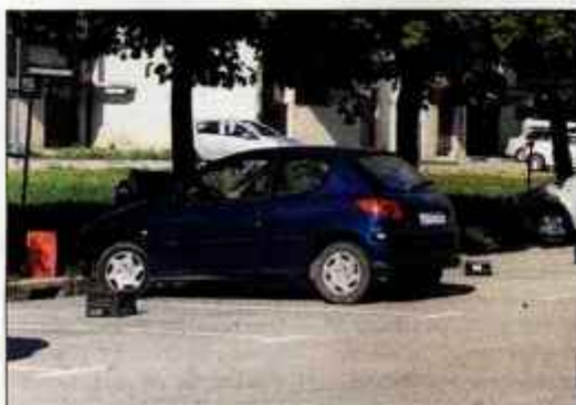
Gajbice na skupnem parkirišču pred bloki na Škofjeloški ulici v Medvodah