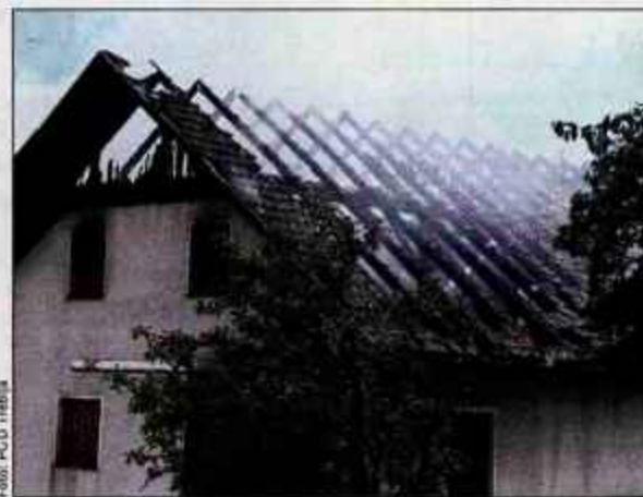
Požar je najverjetneje izbruhnil zaradi samovžiga sena.

krat 14 metrov je razdeljen na dva dela. Spodnji del služi za hlev, v zgornjem pa je bilo shranjeno seno in kmetijski stroji. Kriminalistična komisija je ugotovila, da je požar izbruhnil v zgornjem delu gospodarskega poslopja, v delu, kjer je bilo seno, staro in novo. Na seno, ki je bilo pripeljan na novo, je pred vžigom skozi okno sijalo sonce. Policija domneva, da se je novo seno med sušenjem v notranjosti pregrevalo, zato je tudi prišlo do samovžiga.