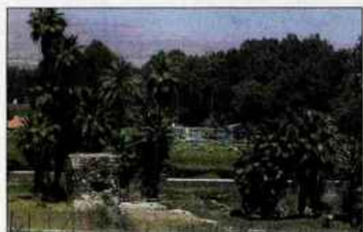
Takole je videti Magdala, vasica Marije Magdale danes.