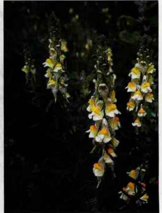
Madronščica je luštna rožica za luštne punce.

Madronščico so zlasti v ljudskem zdravilstvu nekdaj zelo cenili. Ugotovili so, da ima dober vpliv na jetra in ledvice, zato so z njeno pomočjo odganjali strupe iz telesa. Z njo so zdravili vodenico in zlatenico. Iz nje pa so znali pripraviti tudi učinkovito zdravilo zoper hemoroide oziroma zlato žilo. S tem mazilom so mazali tudi bule in čire. Pri turih in razjedah so jo uporabili tudi v obliki kašastega obkladka. Ljudsko zdravilstvo je madronščico s pridom uporabljalo pri poškodbah kože, proti kožnim madežem in nečistočam. Iz sveže nabrane zeli iztisnemo sok in svežega uporabljamo za čiščenje ali za vtiranje.