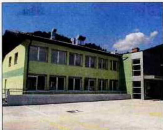
Nova stavba visoke šole ima fasado v svetlo zelenih tonih.