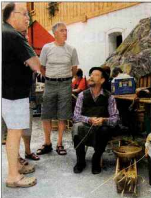
Predstavitve domačih obrti pred muzejem