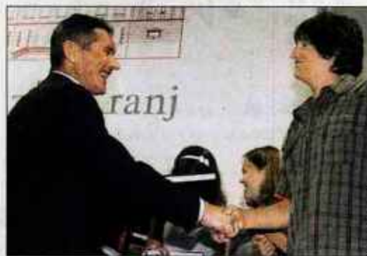
Podelitev maturitetnih spričeval na kranjski gimnaziji.