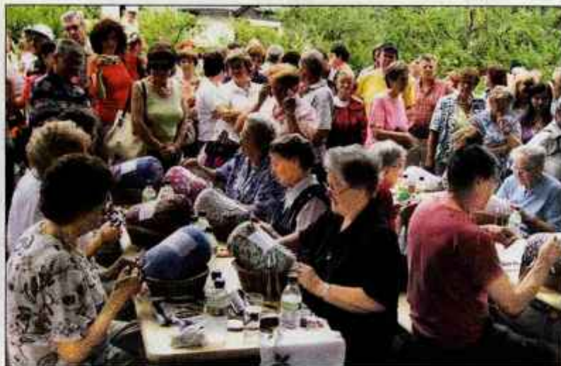
Obiskovalci so z zanimanjem opazovali klekljarsko tekmovanje.

Že tradicionalno je na zadnji dan dogajanje najbolj pestro. V nedeljo so se številni obiskovalci z zanimanjem sprehajali ob stojnicah, na katerih so predstavljali domače obrti in kulinariko.