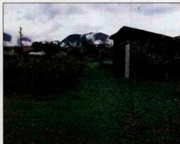
Do napada je prišlo pri vrtičkih ob Poljski poti v Radovljici.

jal ob železniških tirih v Radovljici. Ko je prišel do tamkajšnjih vrtičkov, je na tirih zagledal nekoliko oglušlega vrtičkarja in ga opozoril, da se približuje vlak, ter ga s tem obvaroval pred najhujšim, pripoveduje. Kmalu zatem pa ga je čakalo pravo presenečenje. Ko se je približal vrtu 32-letne Radovljčanke, je proti njemu iz pesjaka pritekla rotvajlerka. "Gospo sem opozoril, naj psa zapre, nato se je med nama vnel prepir," pripoveduje. Po njegovih besedah ga je z nogo sunila v trebuh, da je padel na ograjo sosednjega vrta, nato pa naj bi z vilami zamahnila proti njemu, a se je ubranil z roko. "Z vilami me je udarila v levo roko, v drugo roko pa me je med pretepom ugriznil pes," se spomi-