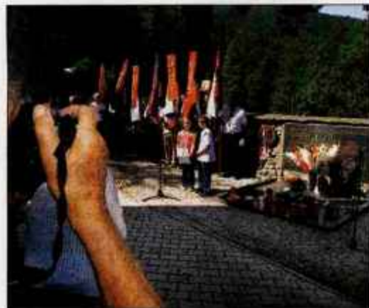
Ob grobu talcev v Kokri so se v nedeljo spomnili požiga vasi pred 66 leti.

V kulturnem programu so nastopili ženski pevski zbor Kokra, učenca osnovne šole Kokra in predstavniki borcev za vrednote NOB Preddvor. Pred svečanostjo je bila v cerkvi v Kokri sveta maša za talce.