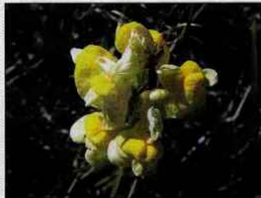
Madronščica je doberdejna pri zlati žili.

V času cvetenja nabere mo sveže madronščice in jo na drobno zrežemo. Štiri jedilne žlice zeli prelujemo s tridesetimi litri vrele vode. Počakamo eno uro, nato precedimo in natočimo v litrsko steklenico. Nato prilijemo še četrt litra visoko odstotnega alkohola, pretočimo v majhne stekleničke in hranimo v temni in hladni prostori. Če si vtiramo to tinkturo, naj bi kožne pege na obrazu kmalu izgubile.