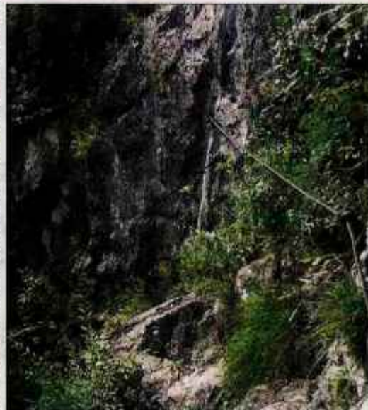
Polica do priznice

Nadmorska višina: 676 m Trajanje: 2 uri Višinska razlika: 350 m Zahtevnost: ★★★★★