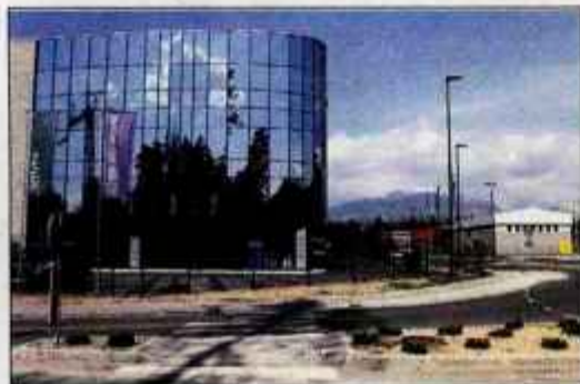
V Poslovni coni Komenda danes deluje že veliko podjetij, na voljo je še 15 hektarjev zemljišč.

Del ponudbe bo obsegala tudi mreža storitvenih oziroma podpornih dejavnosti, kot so banke, pošta, trgovski in gostinski lokali. "Naša želja je, da privabimo raznovrstna podjetja, ki bodo izvajala dejavnosti z visoko dodatno vrednostjo, so tehnološko in razvojno napredna ter