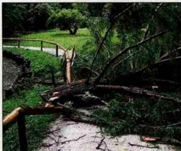
Odlomljeni vrh najlepše močvirske ciprese ob jezeru rdečega javorja je močan veter nesel več metrov.