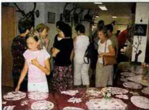
Tokrat je bila razstava čipk tudi v lovskem domu.