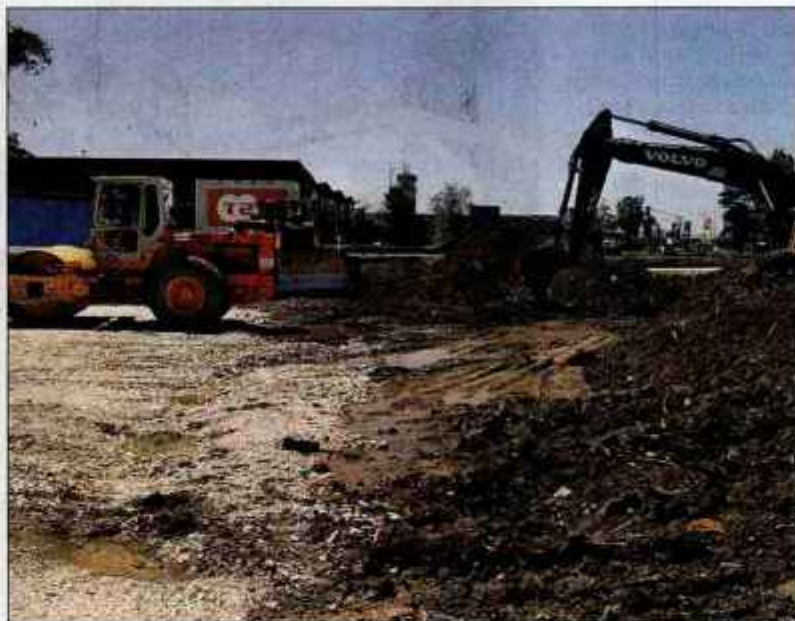
Parkirišče na severni strani Letališča Jožeta Pučnika Ljubljana je prvi objekt, ki sega čez regionalno cesto Kranj-Mengeš.

Severno parkirišče z dostopno cesto in navezavo do glavnega terminala bo SCT