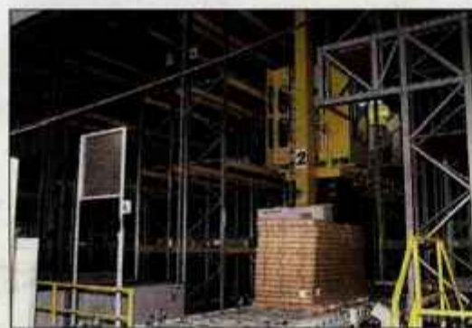
Avtomatizirani skladiščno logistični center

Nov skladiščno-distribucijski center se razprostira na 6.000 kvadratnih metrih površin in je razdeljen na dva dela. Večjega s 4.800 paletnimi mesti zavzema skladišče. Visokoregalno avtomatizirano skladišče ima za osnovno transportno sredstvo dve avtomatsko vodeni regalni dvigala na vodilih. Vsi premiki so vnaprej pripravljeni, tako sta dvigala optimalno zasedeni. Kabina dvigala je vodena z brezžično povezavo. Glavna funkcija dvigala je avtomatsko transportiranje palet z artikli s podporo najsoodobnejše informacijske tehnologije. Prednosti novega skladišča bodo predvsem v kvalitetnem