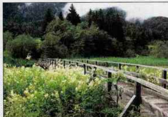
V Zelencih urejajo nove sprehajalne poti.