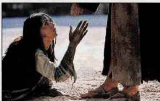
Takole je Marijo Magdaleno v Kristusovem pasijonu Mela Gibsona prepričljivo zaigrala Monica Bellucci.