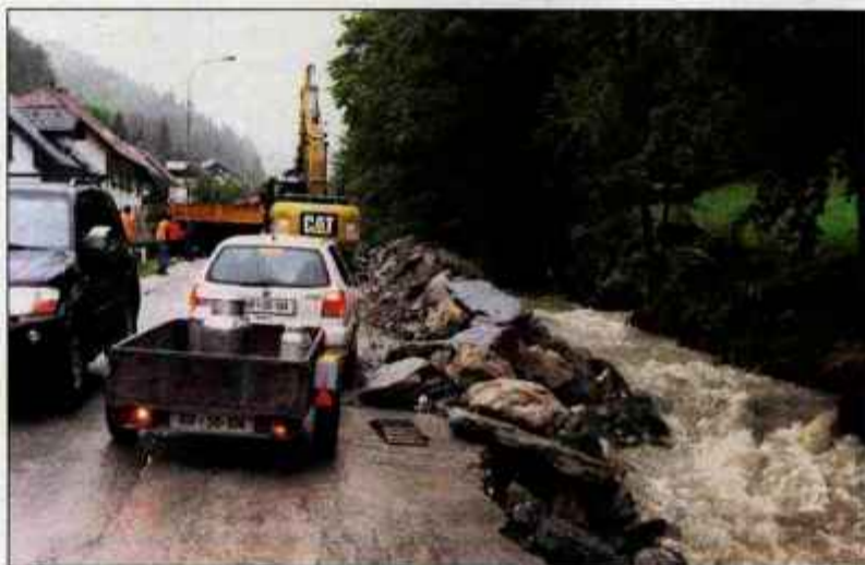
Gradbišče ob strugi potoka Češnjica, kjer gradijo oporni zid.