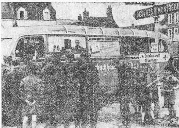
Potujoče nemške vojne knjižarne, kjer si morejo vojaki kupiti tudi najnovejše knjige

važne od brezpomembnih. Ker je bilo nešteto najetih in prostovoljnih agentov, ni bilo mogoče ugotoviti, kateri poroča resnico in kateri se dela važnega ali celo namenoma pošilja napačna poročila. To so kmalu občutile vse države. Zato se je poleg te špijonaže »en gros« kmalu formirala tudi špijonaža posebno nadarjenih posameznikov. V posebnih misijah so pošiljali spretno, izvežbane in zanesljive častnike, ki so imeli popolno svobodo, da so smeli izvesti svojo nalogo po svojem lastnem načrtu ali pa so dobili od svojih predstojnikov samo najširše direktive.