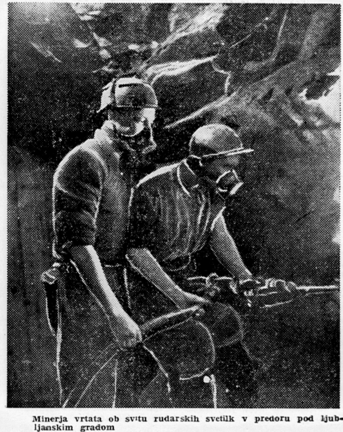
Minerja vrtata ob svitu rudarskih svetilk v predoru pod ljubljanskim gradom