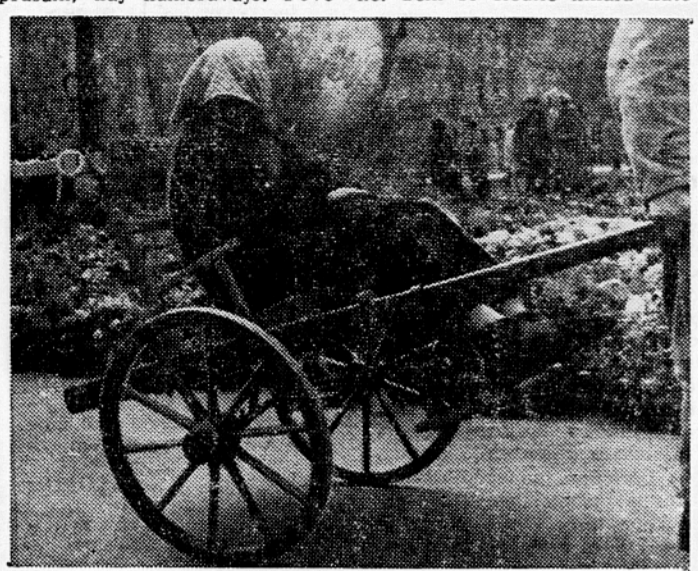
Hroma ženica, ki ni mogla priti na pogreb, je vsaj tako hotela izkazati poslednjo čast Borisu Kidriču

Manjkalo je kakih 10 minut do 13 ure. Tedaj so se oglasile v Novi Gorici tovarniške sirene. Tem so sledile kmalu nato