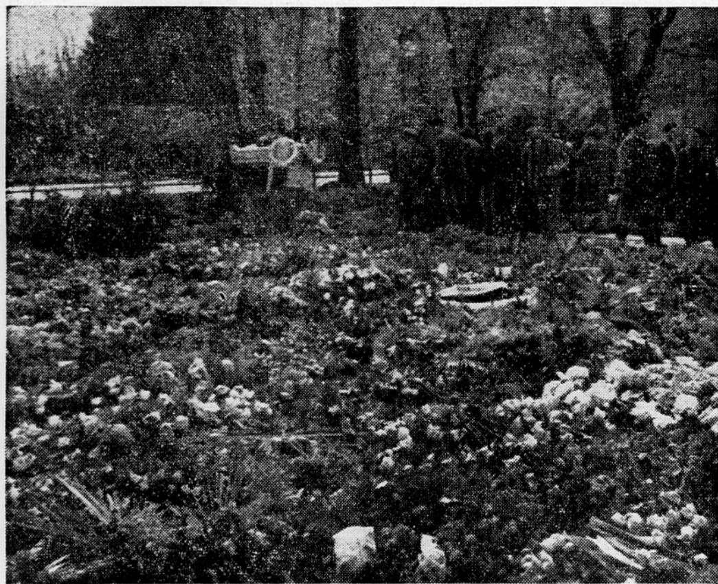
Se vedno prihajajo mnogi na grob Borisa Kidriča. Niso mogli priti na pogreb, pa v teh dneh izkazujejo poslednjo čast mrtvemu revolucionarju. Med mnogimi so prišli tudi dijaki iz Ogulina, ki so napravili svoj šolski izlet na grob velikega sina naših narodov.