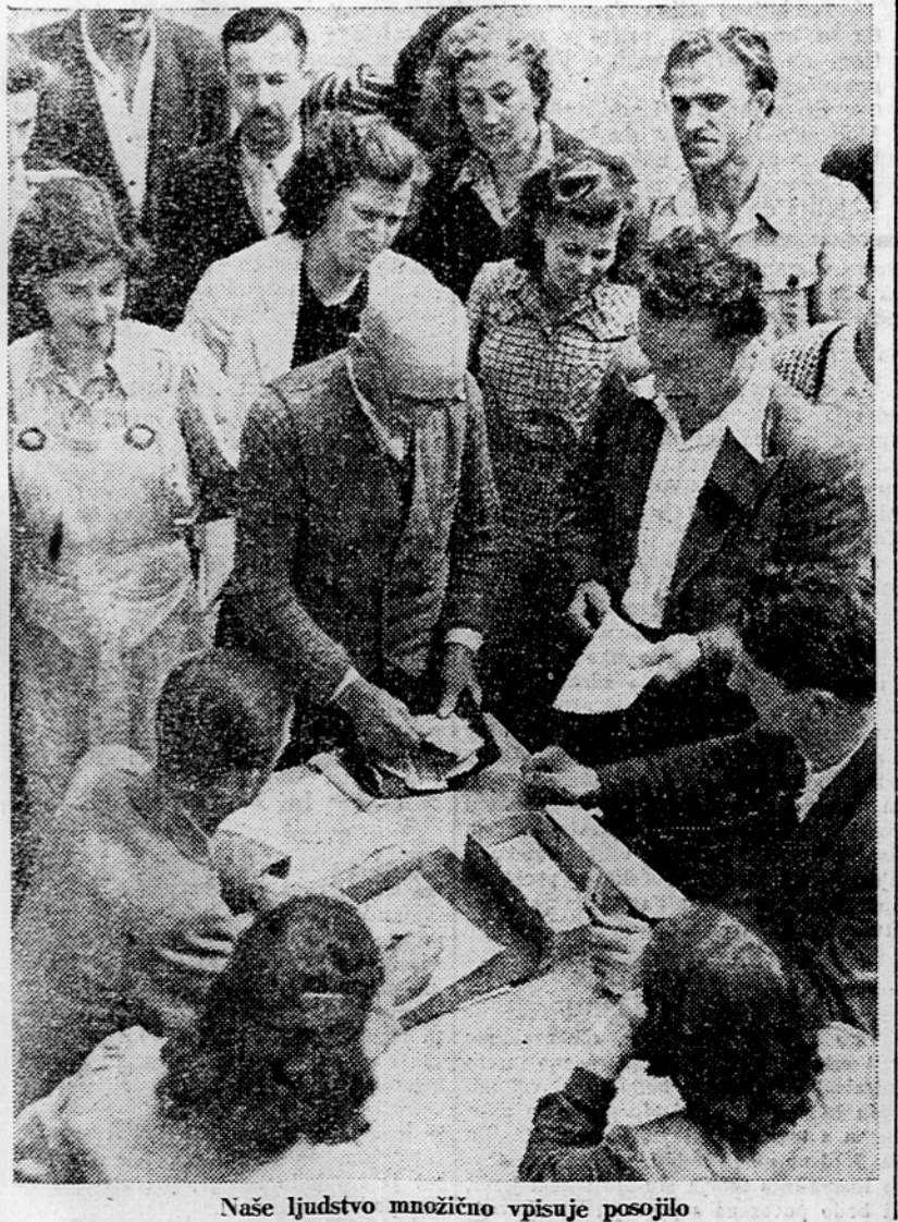
Naše ljudstvo množično vpisuje posojilo

Popolnoma se strinjamo z izjavo CK KPJ in odgovorom Informativne biroja komunističnih partij. Obljublamo, da bomo še v naprej odločno delali za uresničenje politike Partije, ker vemo, da nas Partija z njenim Centralnim komitejem na čelu sigurno vodi k socializmu.