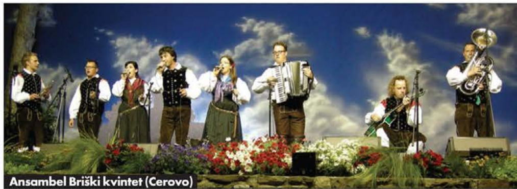
Ansambel Briški kvintet (Cerovo)