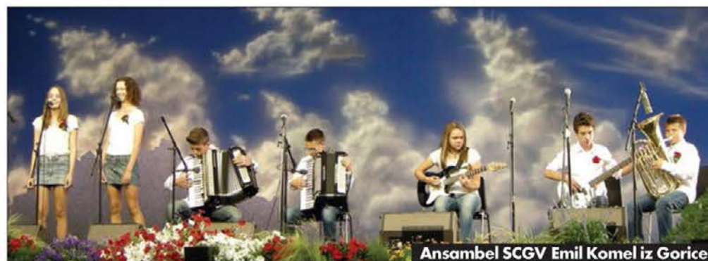
Ansambel SCGV Emil Komel iz Gorice

posredno oškodovala tudi delovanje števerjanskega društva. "Upam, da nam bodo vsaj naši slovenski politiki stali ob strani in do zadnjega skušali preprečiti ukinitve naše občine", ki je društvu vselej "dragocena sogo-