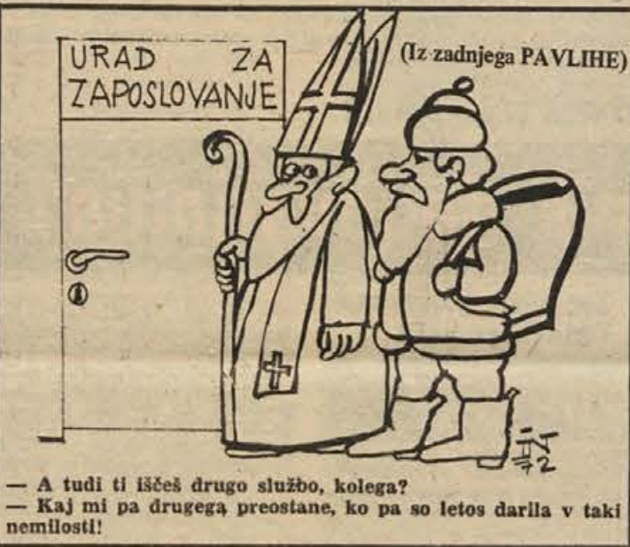
(Iz zadnjega PAVLIHE) — A tudi ti iščeš drugo službo, kolega? — Kaj mi pa drugega preostane, ko pa so letos darila v taki nemilosti!

Če želimo v prihodnje po tej poti še kaj več narediti za naš