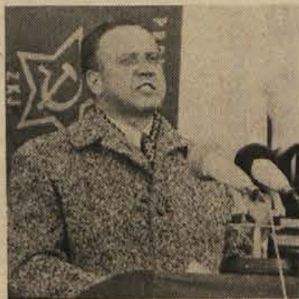
„Spoštovanje dela in delovnega človeka oblikuje moralno podobo posameznika in vse družbe . . .“