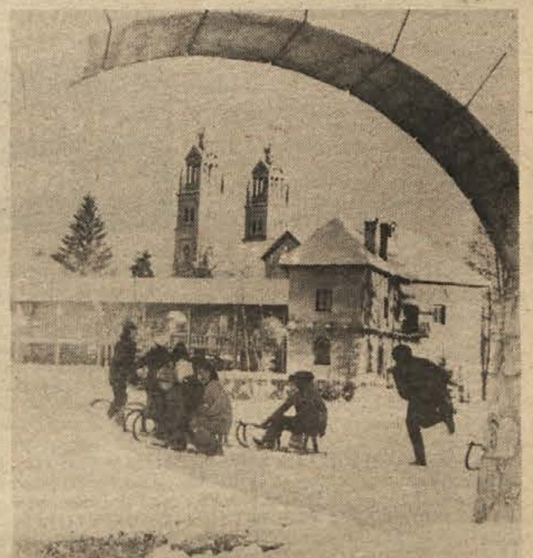
V veselje malih prebivalcev Ribnice je pri njih zapadlo veliko snega. Tako so se v prazničnih dneh, ko jim ni bilo treba v šolo, lahko otroci nasankali, kolikor so hoteli. Na sliki: otroci so se najraje zatekli k obnovljenemu delu ribniškega gradu.

Stevilni gostje, družbeno politični delavci, poslovni prijatelji in člani (Nadaljevanje na 4. strani)