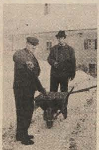
Da bo varna hoja

Teh primerov žal ni malo. Od upoštevanja reda je odvisno normalno življenje v prometu. Borimo se torej za red pri vseh!