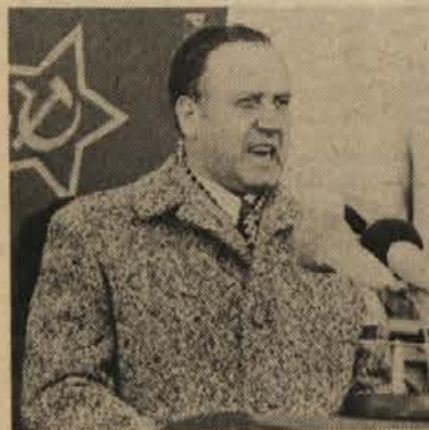
„Moramo omogočiti idejno in politično razgibanost ljudskih množic in odločujočo prisotnost njihove moči v družbenem dogajanju . . .“

Pred koncem svojega govora se je tovariš Popit kritično obrnil tudi na Koroškem. Želimo si prijateljskih odnosov in sodelovanja z Avstrijo, vendar ne za ceno pravic, ki smo jih skupno zagotovili koroškim Slovencem, je dejal. Poudaril je, kako je in ostaja naša mirovna politika odločna, kakšna je vloga in ugled Jugoslavije med nevtralnimi državami in kako dosleden je naš boj za neodvisnot narodov in za pomoč nerazviti-