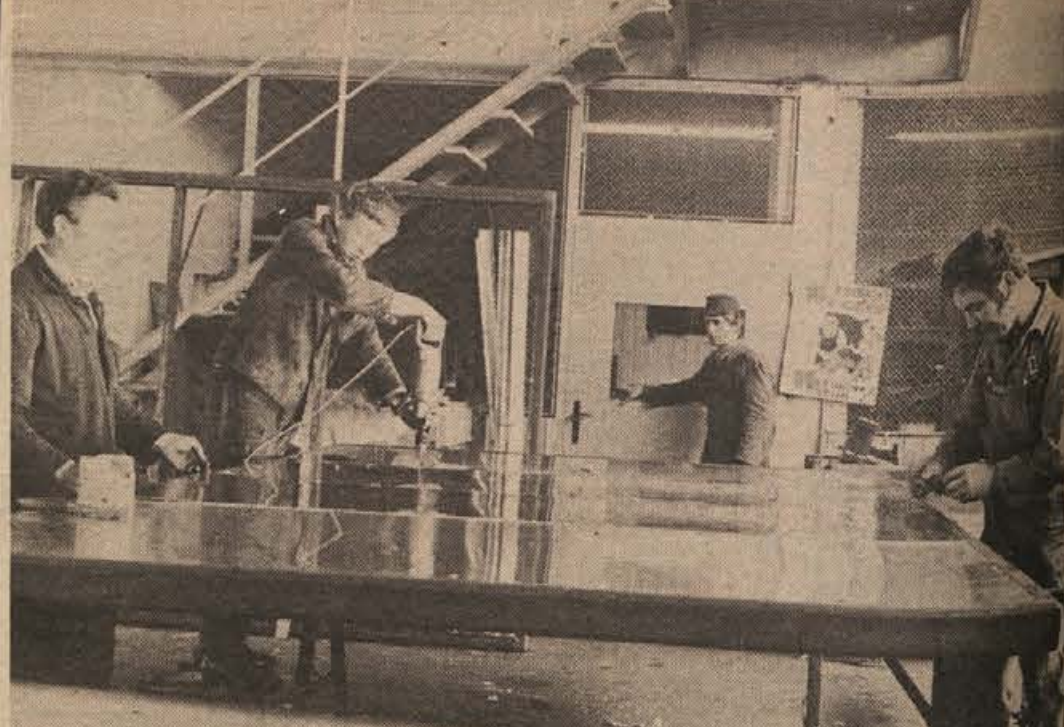
V delavnici Specializiranega podjetja za industrijsko opremo v Krškem. Pričakovati je, da se bosta kolektiva SOP in Kleparstva iz Kostanjevice združila. Upravičenost integracije bosta utemeljili šele komisiji obeh podjetij, ki jima bo pomagala komisija občinske skupščine v Krškem.

V blokih s centralnim ogrevanjem ima stanovanjsko podjetje že zdaj težave. Kurjaško službo bi po pravilih moralo imeti kot svoj servis, temu se pa hišni sveti upirajo. Ti kurjače raje plačujejo sami, ker je to ceneje, zato pa je delo dostikrat manj strokovno.