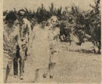
Naši kmetijci si ogledujejo bolgarsko plantažo.