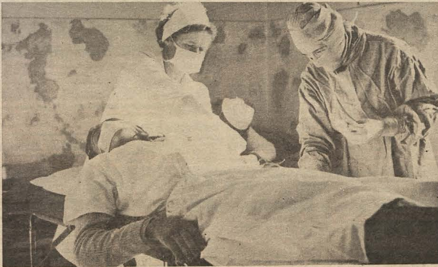
V brežiškem zdravstvenem domu se je 27. in 28. novembra mudila ekipa ljubljanskega zavoda za transfuzijo. Na odvzem krvi je prišlo 378 krvodajalcev. Vseh skupaj so letos našli 913, nekaj manj kot je predvideno po planu. Med darovalci je vedno več žena in mladine.