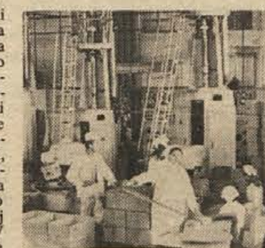
M. L. Našim podjetjem bo manjkalo obratnih sredstev.

Odgovor je obšel bistvo. Najbrž ni opravičilo v tem, češ v Sloveniji sadja ni v zadostnih količinah in moramo za njim v druge republike. To je samo trenutna rešitev, dolgoročna pa gotovo ne. Povpraševanje za sadnimi sokovi je resda zelo veliko, toda tudi konkurenca med izdelovalci je vse hujša. Uspeval bo tisti, ki bo lahko ponudil boljši izdelek in ki bo cenejši, tisti, ki bo imel blizu zagotovljeno surovino - sadje dobre kakovosti. To pa ne bo prišlo samo po sebi in v slabo lahko štejemo podjetju, ki ni po tej plati še skorajda ničesar naredilo. V škodo sebi, da o kmetijstvu sploh ne govorimo.