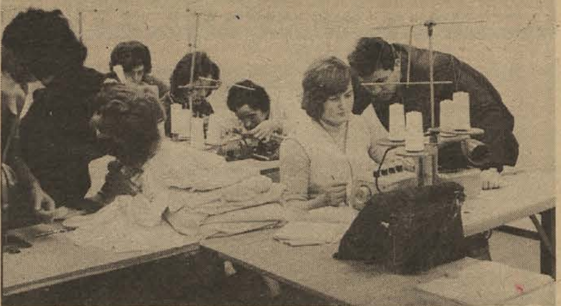
Novomeški ROG ureja v Mokronogu nov obrat za izdelovanje ženskih spalnih srajc, večinoma za izvoz v Zahodno Nemčijo. Kako je bila ta odločitev za ta zaostali del občine koristna, pove podatek: samo na enkratni razpis, ko se niso niti urejali prostorov, se je prijaviilo 90 deklet in žena! V teku je poskusna proizvodnja in priučevanje. Obrat bodo odprli še pred novim letom. Na sliki: delo v lepo urejenih prostorih; za marsikatero ženo nič več dolgih voženj na delo v oddaljene kraje.