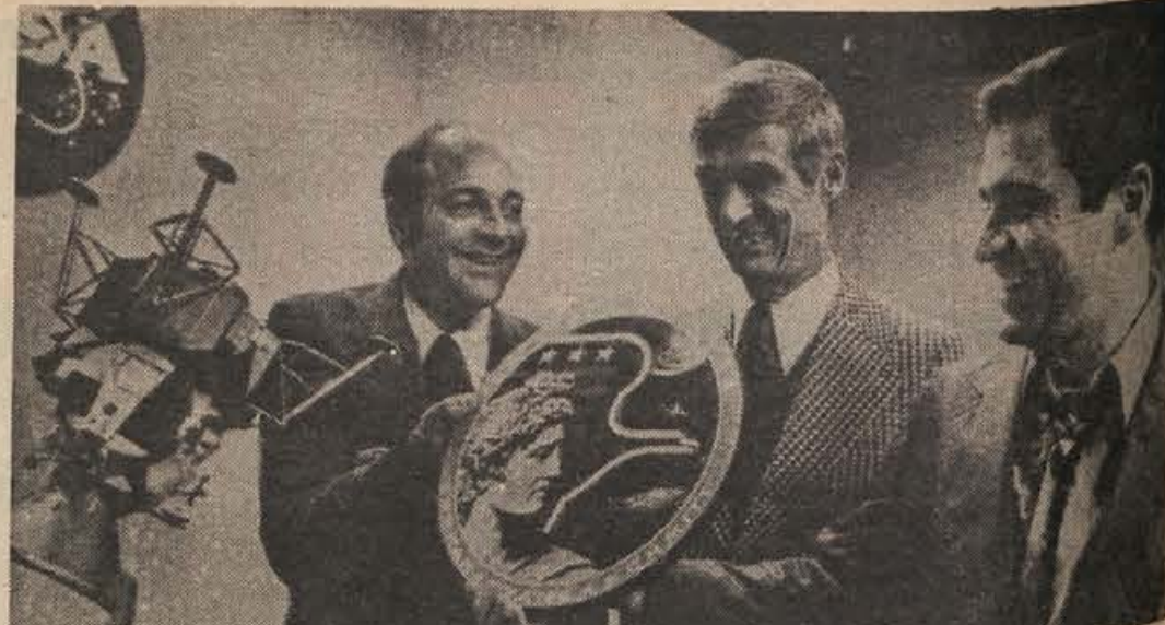
Posadka Apolla-17, ki bo danes poletela proti Luni, je pozirala uradnemu fotografu agencije NASA (na sliki) držec v rokah grb svoje vesoljske odprave. Zanimivo je, da je bilo nekaj časa videti, kot da bodo morali start preložiti — zaradi stavke osebja NASA, ki je zahtevala višje plače! To bi bilo prvič, da bi se zgodilo kaj takega, toda v zadnjem trenutku so uspeli vendarle doseči sporazum med uslužbenci in upravo in tako bo lahko odprava Apolla-17 (vsaj kar zadeva stavko) nemoteno poletela proti Luni. Srečno pot in srečen povratak — 19. decembra ob 19.24 na valove Tihega oceana.

družbeni razvoj, in to je nujno, potem mora delovni človek v celoti razpolagati s sredstvi, ki jih daje za skupne družbene potrebe, pa naj gre za denar iz skladov podjetja ali iz žepov posameznikov. Delegatski sistem kot osnova delovanja skupščin, ki ga snujemo v drugi fazi ustavnih sprememb, mora prevladati povsod: v skupščinah, interesnih skupnostih, pri rednih in občasnih skladih, skratka povsod, kjer se zbira denar za ureditev tega ali onega vprašanja skupnega pomena. Le tako bodo delovne organizacije in delavci pripravljivi še z večjo mero solidarnosti in razumevanja sodelovati.