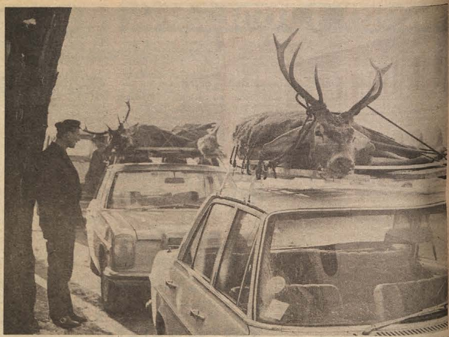
Prejšnji terek so ustavili lovci svoje „makine“, natovorjene z dvema jelenoma, košuto in srno na Glavnem trgu v Novem mestu, kot našli pred mesarijo. Mimoidoči so se ustavljali in občudovali lep kup mesa, toda petični lovci bodo plačali carino in odpeljali pečenko v Italijo...