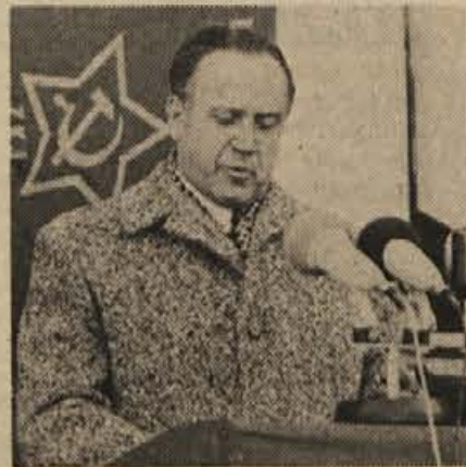
„Komunist je lahko le tisti, ki s svojim vzorom vodi množice, se hoče boriti in braniti interese delovnega človeka . . .“