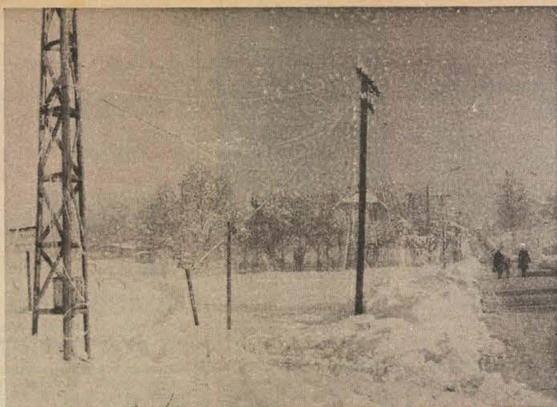
Prvi sneg je povzročil na Kočevskem precej nevšečnosti, med drugim je tudi »zmešal« ali potrgal telefonske linije oziroma žice, povzročil neprijetnosti v prometu, 27. novembra zvečer pa je pogosto zmanjkovalo elektrike. Na sliki: potrgane telefonske žice na Rudniku, slikano 26. novembra.

Ob »barčku« sta slonela fanta, ki sta pravkar naročila steklenici piva. Mimo sta se pogovarjala, ko je k njima pristopil Mak in enemu izmed njiju rekel: »Daj mi požirek.« Fant, ki ga je Mak nagovoril, se zanj ni zmenil, zato je Mak prošnjo ponovil, pridržal pa se mu je še Boris. »Daj, daj mi požirek,« je ukazal ta. In res, Mak je segel po steklenici in se dobro odžejal. Boris pa s tem ni bil zadovoljen, hotel se je odžejati še on. Fant s pivom se je upravičeno uprl: »Piva ne dam!« No, pa je svoje mnenje hitro spremenil, ko je videl, da Boris z njegovim odgovorom ni zadovoljen. Še enkrat je popustil in tudi Boris se je odžejal. Nato