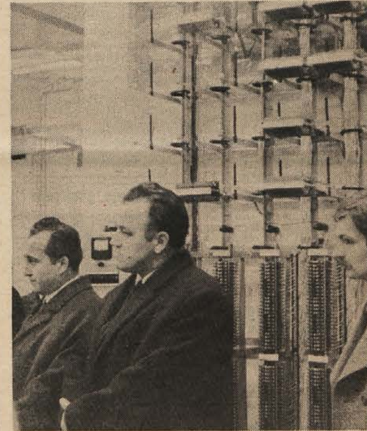
Tam, kjer je bilo nekdan v Metliki javno kopaljšče, so pred 29. novembrom odprli novo avtomatsko telefonsko centralo. Ta omogoča mnogo boljše telefonske zveze čez Gorjance in v sami Beli krajini. Na fotografiji: na otvoritveni slovesnosti zbrani gostje.

V metliški občinski skupščini so predlagali ustanovitev aktivna odborikov komunistov, na katerem bi pred vsakim zasedanjem obravnavali gradivo in do njega zavzeli stališča. Seveda bi morali to tudi zagovarjati v občinskih klopek. Vprašanje je tudi, kaj je s klubi odbornikov, ki jih je že prej predlagala Socialistična zveza in niso zaživel. V teh klubih pa bi morali odborniki odigrati svojo vlogo navzven. Potrebni jih je več stikov z volilci, morali bi vedeti za njihovo mnenje, preden glasujejo za ta ali oni občinski odlok, ki zadeva vse občane. Zdaj je tako glasovanje večinoma odsev odločitve posameznega odbornika.