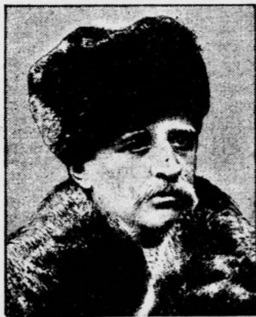
Adolf Erik Nordenskjöld, slovití švedski polarni raziskovalec Grönlanda in Spitzbergov, se je narodil pred sto leti, 18. novembra 1892. L. 1897. je odkril Beringovo ožino