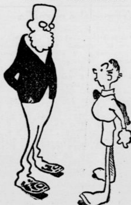
»Nu, sinko, kako je bilo danes v šoli?« »Imenitno, očka — učitelj je dejal, če bi bil vsi šolarji taki kakor jaz, bi lahko takoj zapri šolo.«