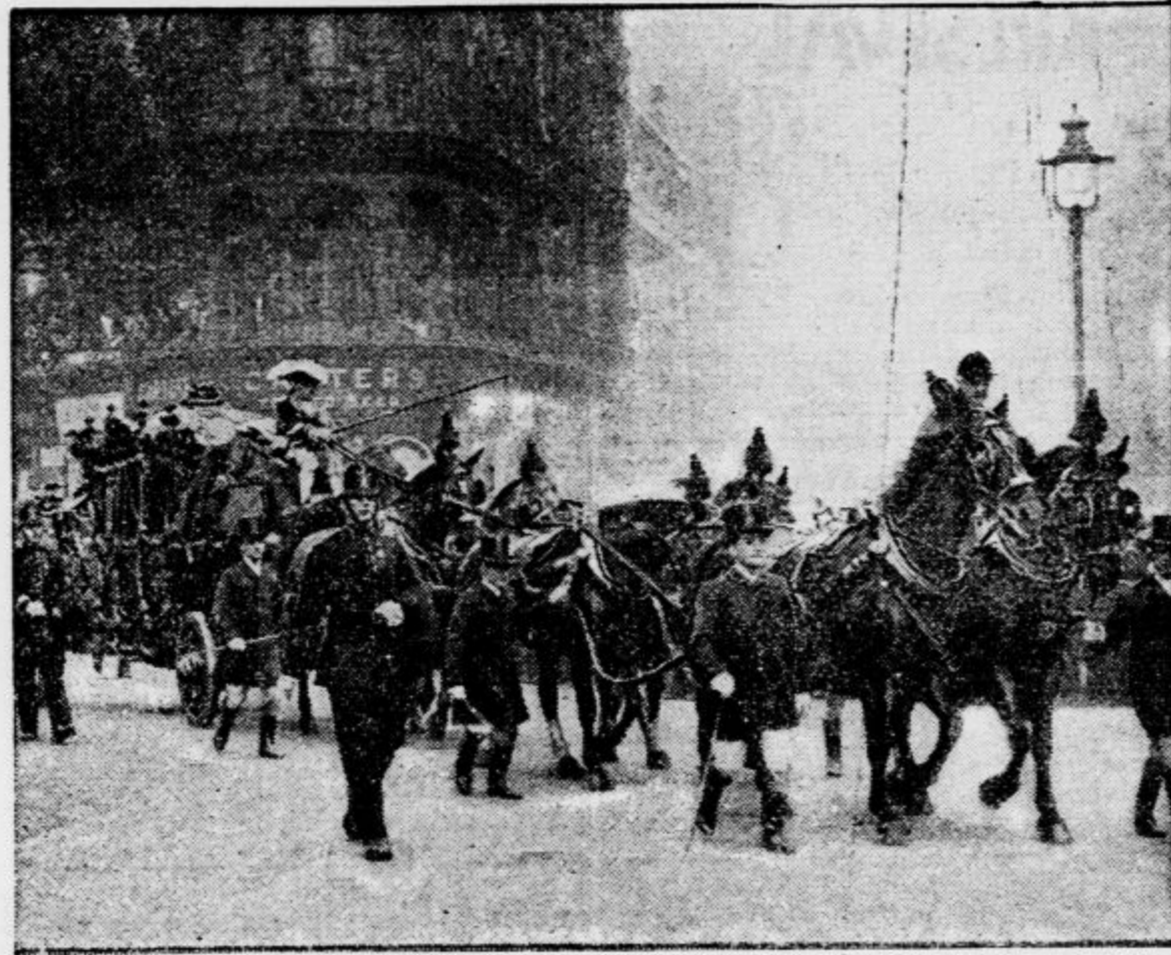
Po vzoru svojih prednikov se je te dni peljal londonski lordimajor (župan) v 300 let stari kočiji po mestnih ulicah. Na ljubo tej stari ceremoniji je moral nekaj časa v Londonu počivati ves ostali promet