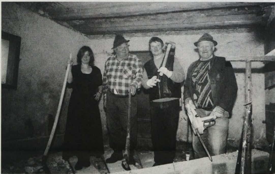
Skoraj pol ducata pridnih rok pri delu. Gradbena dela vodi Miha Kuchar, ki ga ni na sliki

Časovni okvir za obnovo je zelo skromen. Do začetka maja naj bi bila okvirno zaključena.