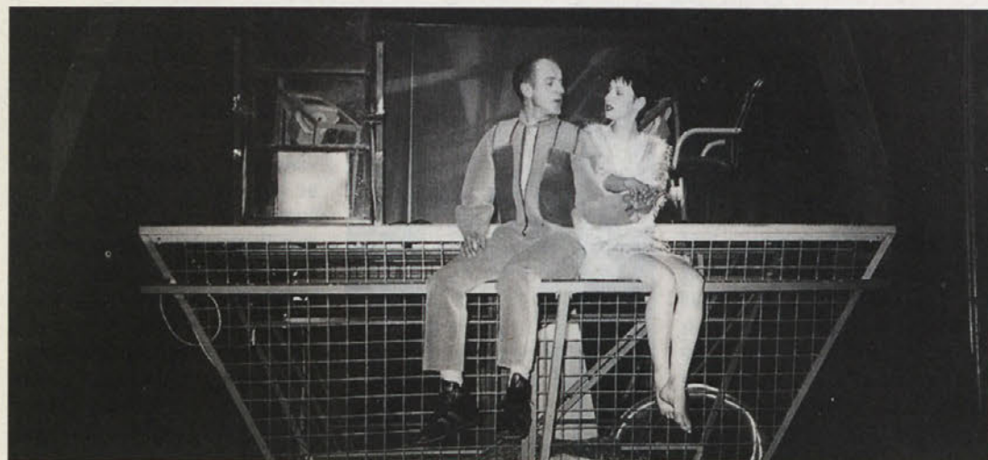
Prizor z vaje

Kako bi označil tvoje gledališče? Je to avantgardno, morda eksperimentalno gledališče?