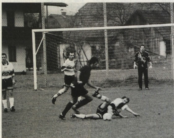
Globašani so se borili do konca, a spet ni zadostovalo za zmago

maščevalo z zmagovitim golom Rikarjanov. Zadel je Wölbl. Šmihelčani so utrpeli skoraj že rekordni poraz z 1 : 7 proti Grebinju, Žitrajčani pa so v derbiju proti Kapelčanom slavili jasno zmago s 4 : 1. Na lestvici še vedno vodi Šentpavel. T. G.