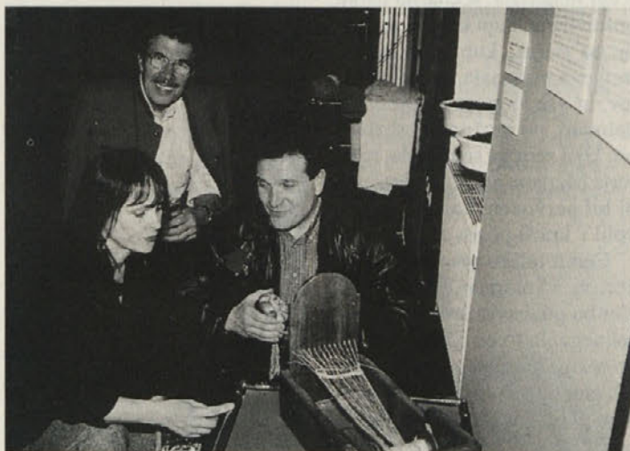
Obiskovalci predmetov niso le gledali, ampak so jih jemali tudi v roke