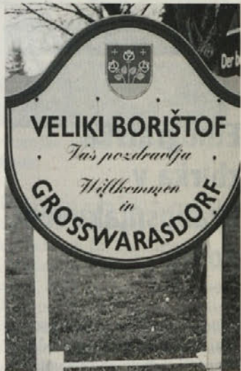
Samozavestna in samoumevna dvojezičnost

V tista leta torej segajo začetki KUGE, ki se nikoli ni