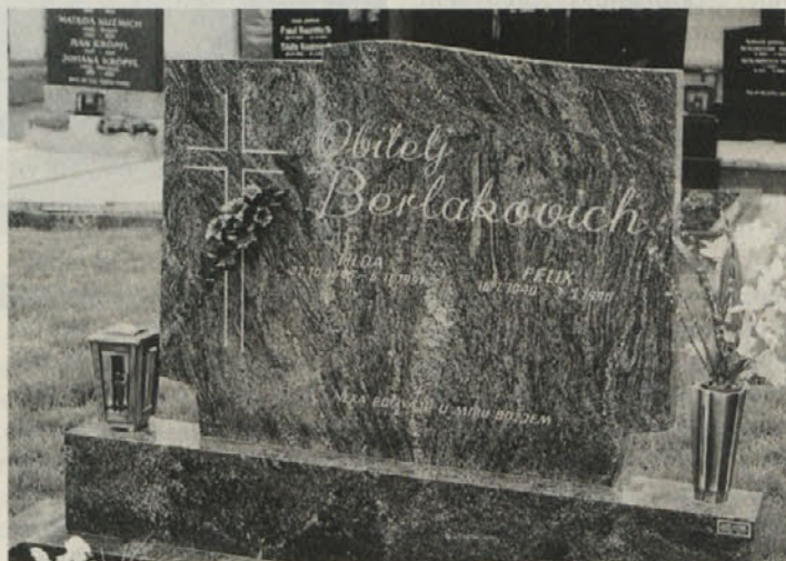
V kamen vklesana identiteta vasi in ljudi