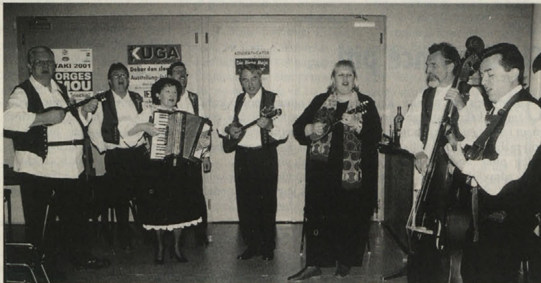
Skupina »Harmonija« je s hrvaškimi napevi pozdravila goste iz Koroške

KUGA je hkrati sedež vaških hrvaških kulturnih društev in pobud, nadalje razstavnih in prireditvenih postor nadregionalnega pomena in obenem največji prireditveni center srednje Gradiščanske. Program KUGE sega od koncertov preko razstav do nastopov mednarodno priznanih