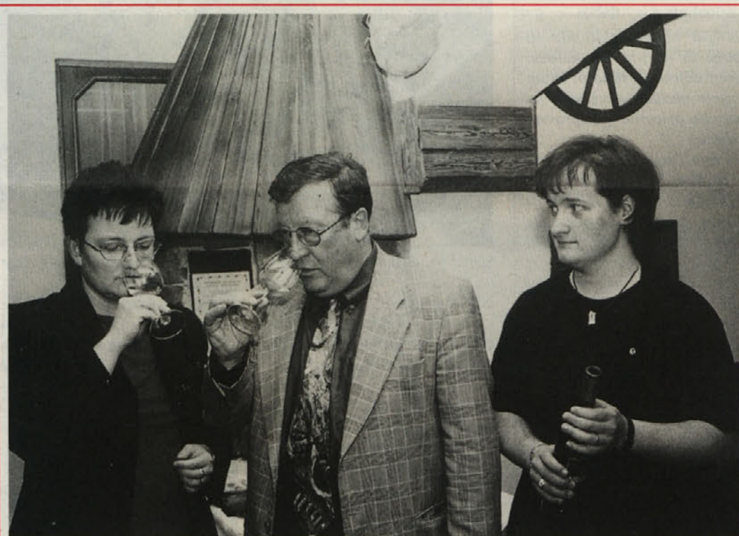
V okviru »Globaškega kulturnega tedna« so se pretekli teden posvetili tudi kulturi pitja in pokušanja vin več na strani 5

cenjevati, je dejal dr. Sturm. »V procesu evropske integracije obstajajo tudi pravni mehanizmi, ki jih pripadniki narodnih manjšin lahko sprožijo za uveljavitev svojih pravic.« Želeti je, je nadalje menil dr. Sturm, da bi koroški politiki spoznali, da je čas starih konfliktov mimo in da mora biti politika usmerjena v prihodnost. -an