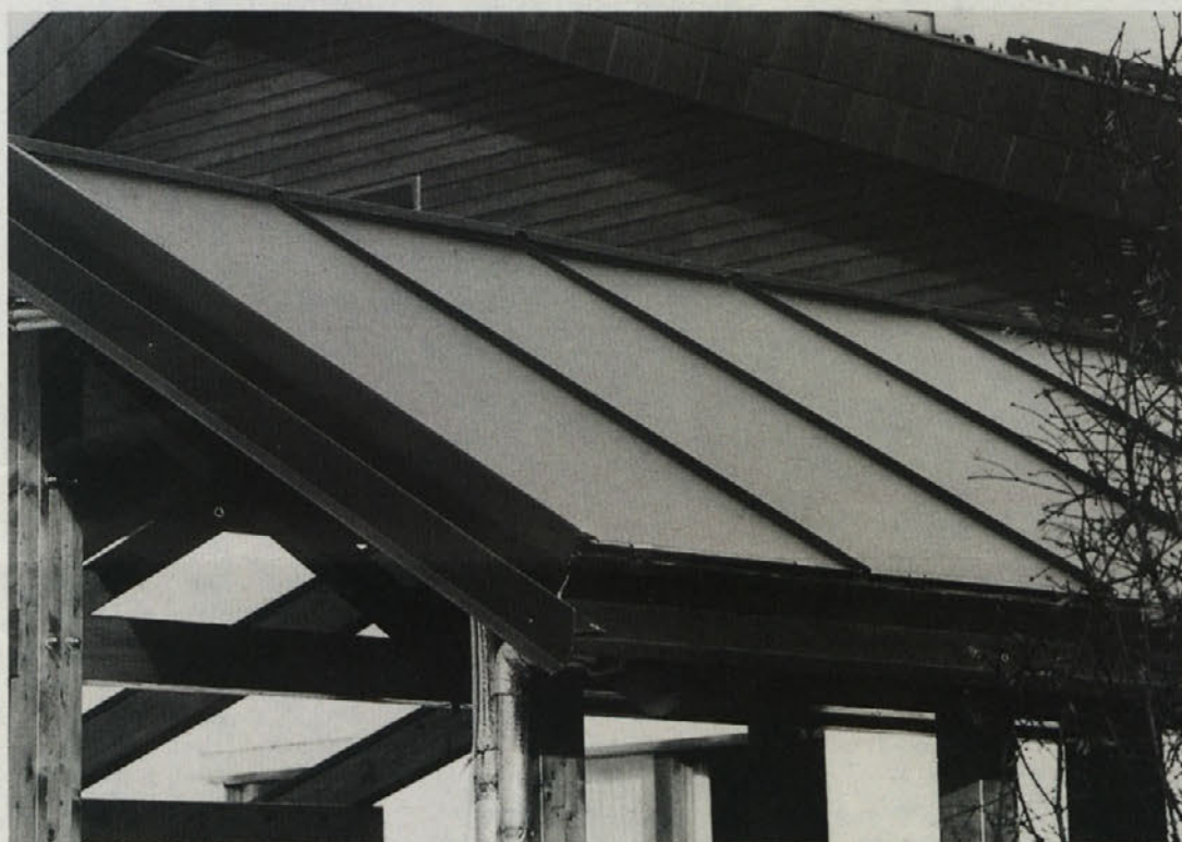
Solarna energija je okolju prijazna