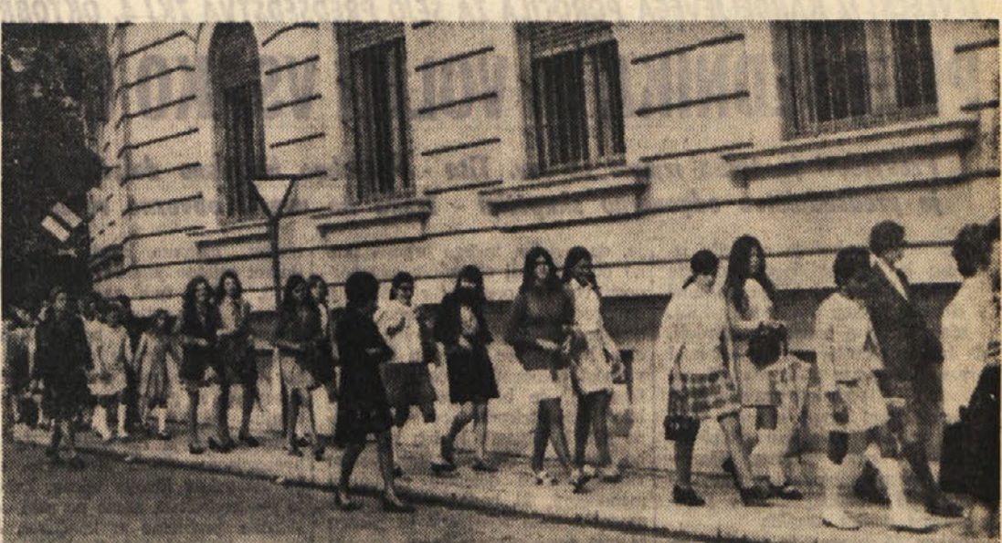
Včeraj so dvorišča slovenskih šol v Gorici zopet zaživele, saj so se na njih zbrali dijakinje in dijaki za začetek novega šolskega leta. Na naši sliki vidimo dijakinje slovenske nižje srednje šole na poti k šolski maši v goriško stoimco