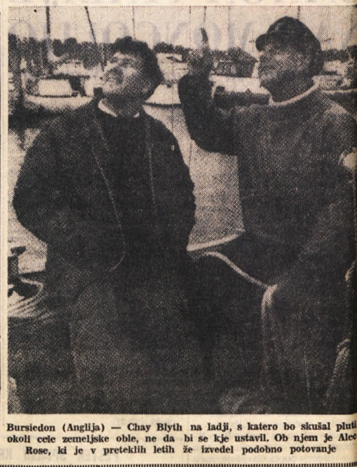
Bursiedon (Anglija) — Chay Blyth na ladji, s katero bo skušal pluti okoli cele zemeljske oble, ne da bi se kje ustavil. Ob njem je Alec Rose, ki je v preteklih letih že izvedel podobno potovanje

za čimprejšnjo sejo. Tudi izmenjava not je naletela na ugoden odmev v nemških krogih.