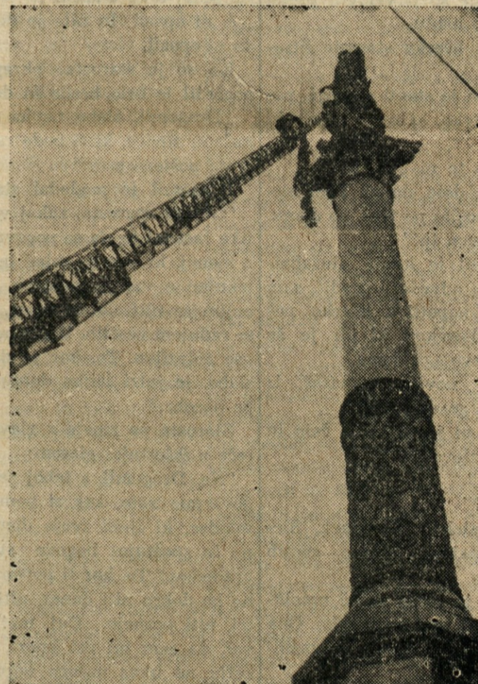
VISOKO — Gasilec je s pomočjo visoke lestve ponese venec na kip Brezmadežne, ki stoji na stebri nad Piazza Di Spagna v Rimu.