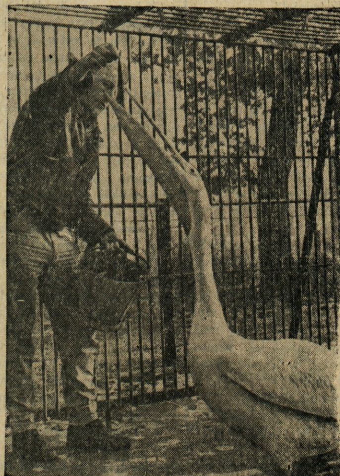
PRI KRMLJENJU — Čuvaj v živalskem vrtu v Montrealu, Que., krmí pelikana.