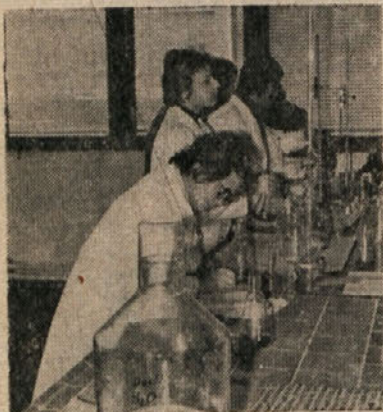
Slušateljice 2. letnika laboratorijskega oddelka poklicne kemijske šole za odrasle v Cinkarni pri laboratorijskih vajah

Komisija za podelitev nagrad »Priznanje samoupravljalcu«