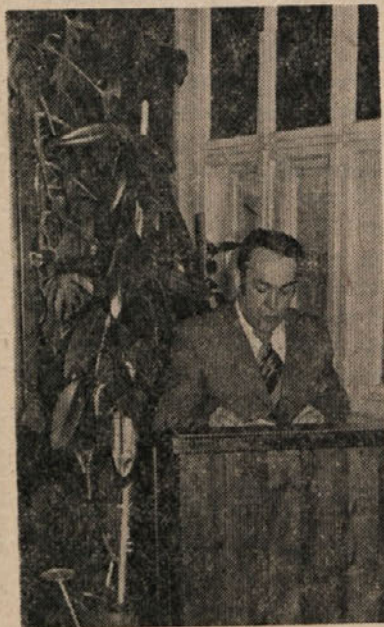
Predsednik konference osnovne organizacije sindikata bere svoje poročilo

V svojem referatu je nakazal vzroke za nizke osebne dohodke. Osebnih dohodkov ne bo namreč mogoče povečati, dokler ne bomo povečali produktivnosti dela. Tudi analitska ocena ne pomeni povišanja osebnih do-